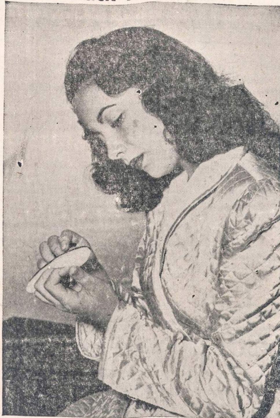
ELIZABETH TAYLOR insists on good grooming at all times, and well cared for fingernails are a 'must.' She shapes them on an emery board, smooths them with a buffer and then adds a clear coat of polish. The lovely young actress is currently to be seen in M-G-M's "Cynthia."

amžiaus moksleivis, pradeda matyt, jam buvo jau aišku, leisti ir redaguoti laikraštį kad pasaulio harmonija, toji "J u v e n t u d" (Jaunuomenė), tvarka randasi ne dievai žino