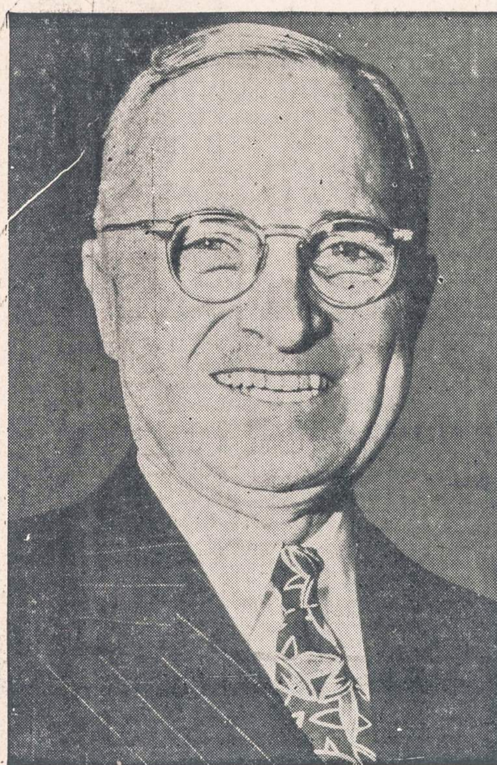
J. V. Prezidentas Trumanas Baltuose Rūmuose vakar priėmė Amerikos Lietuvių Delegaciją.