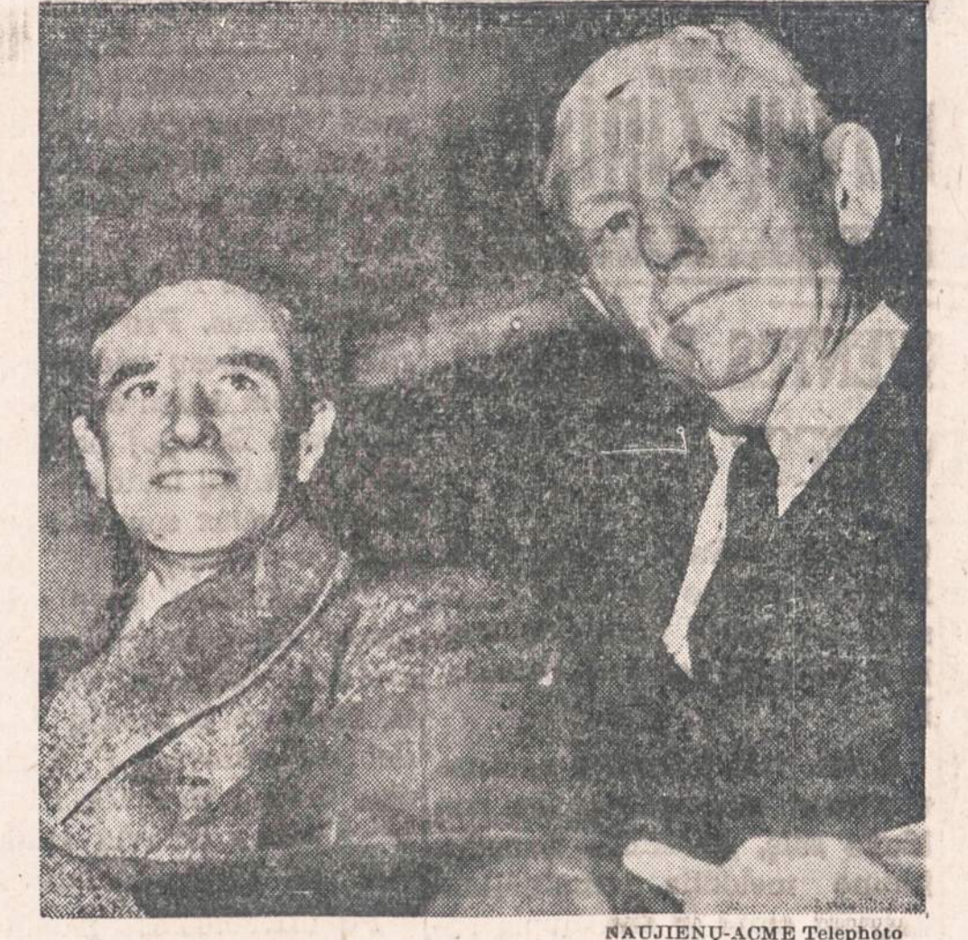
Valstybės sekretorius George J. Marshall (po dešine) Paryžiuje sutinka W. Averell Harriman, Europai atstatai programos direktorių.