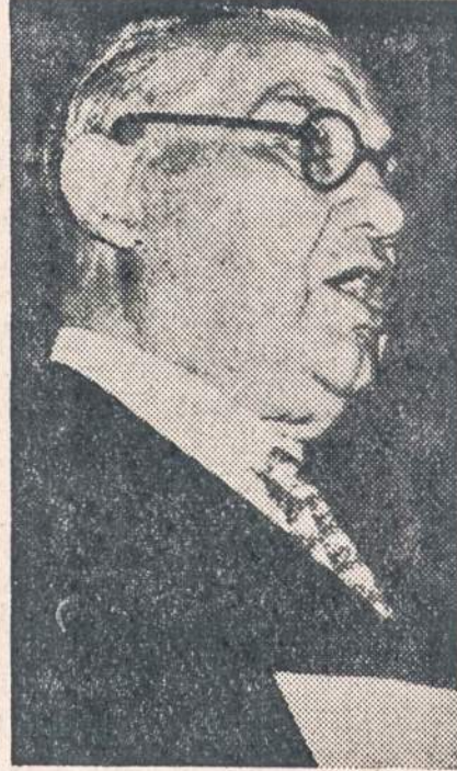
Britų užsienio ministeris.