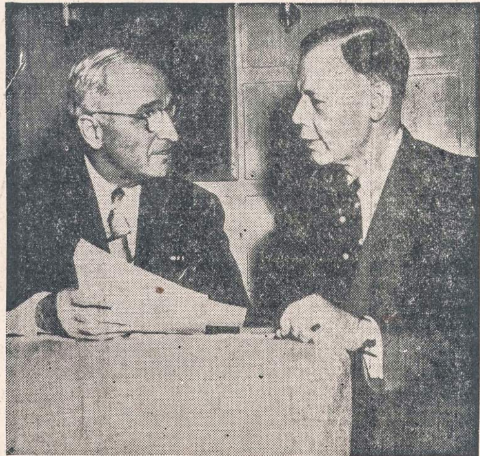
Prezidentas Trumanas (po kairei) ir Walter Bedell Smith, Jungtinių Valstijų ambasadorius Rusijai, konferavo traukinyje Bonham, Texas.