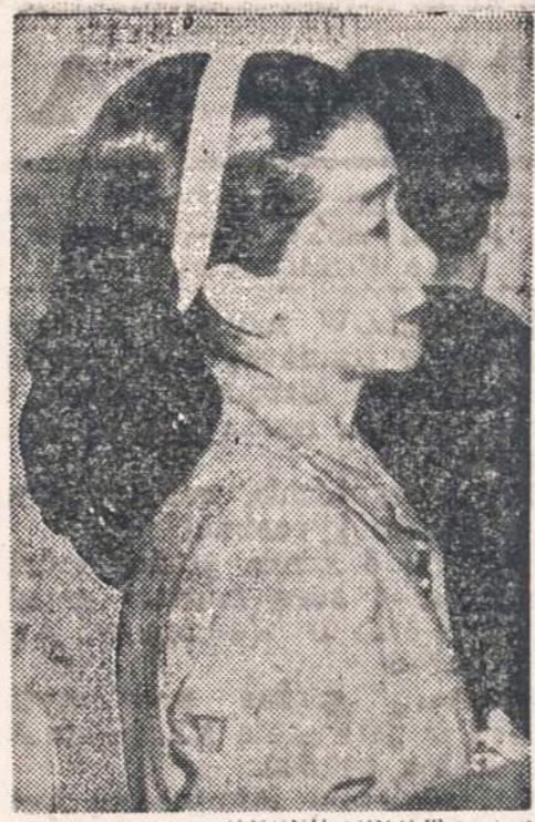
San Francisco, Cal. — Toguri D'Aguiño, žinoma kaip "Tokyo Rožė", Jungtinių Valstijų komisieriaus ofise, kur ji buvo apkaltinta išdavyste. D'Aguiño liepos 4 d. 1916 gimė Los Angeles. Karo metu ji iš Tokyo radio stoties vedė japonų propagandą.