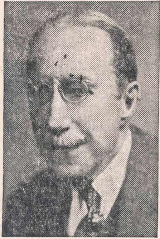
Senatorius Theodore Francis Green, viršininkas Demokratų Tautinio Komiteto Tautybių Skyriaus.

Pirmininkas McGrath paskyrė veteraną Senato rėmėją pasaulinės laisvės viršininku Demokratų Tautinio Komiteto Tautybių Skyriaus.