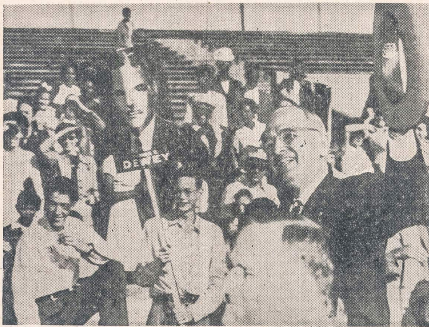
Tulsa miesto Skelly stadione susirinko republikonai pasiklausyti prezidento Trumano kalbos. Iš Tulsa prezidentas išvyko į St. Louis