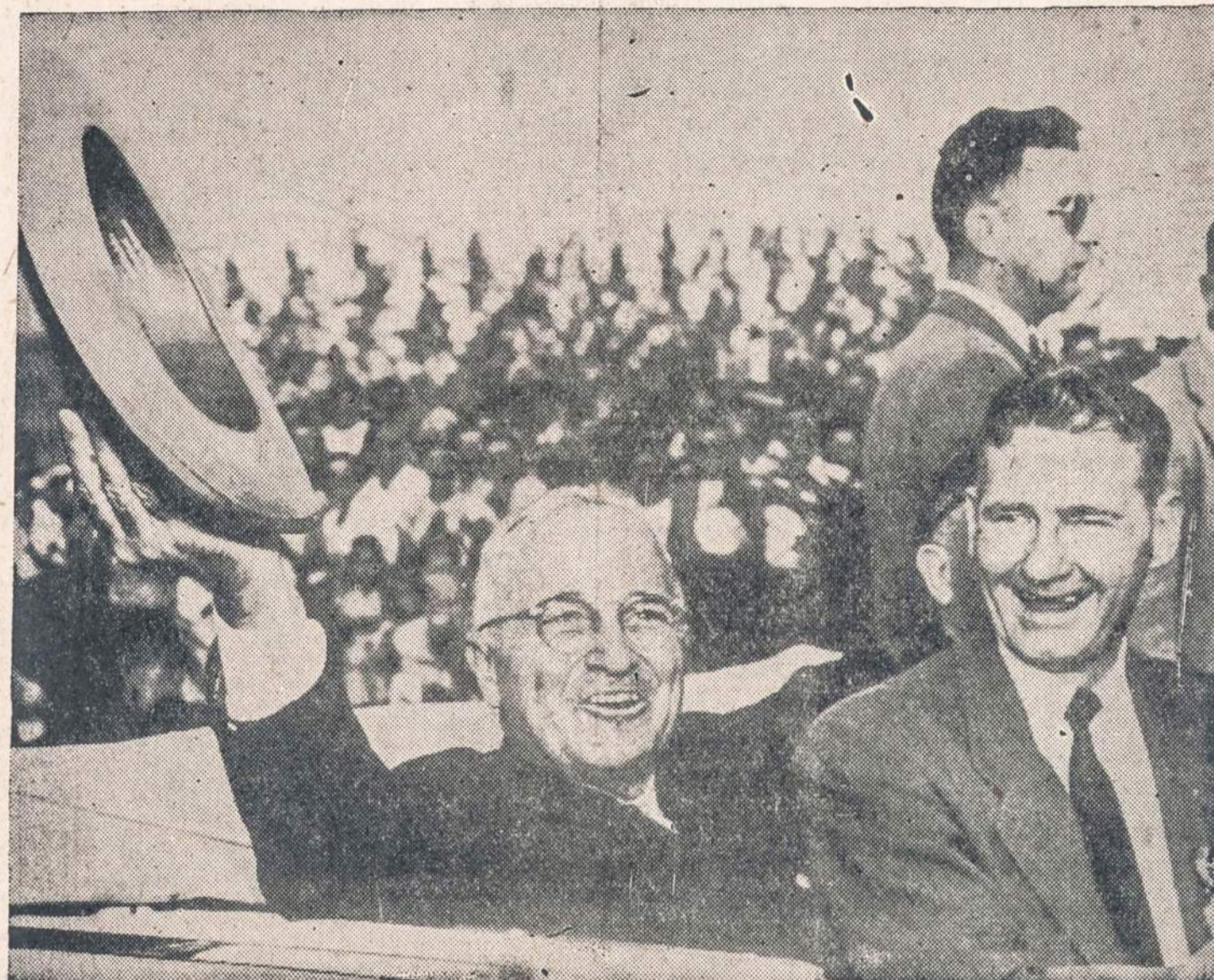
MIAMI, FLA. — Prezidentas Trumanas atvyko į Amerikos Legiono konvenciją. Šalia jo sėdi Floridos gubernatorius Millard Caldwell.