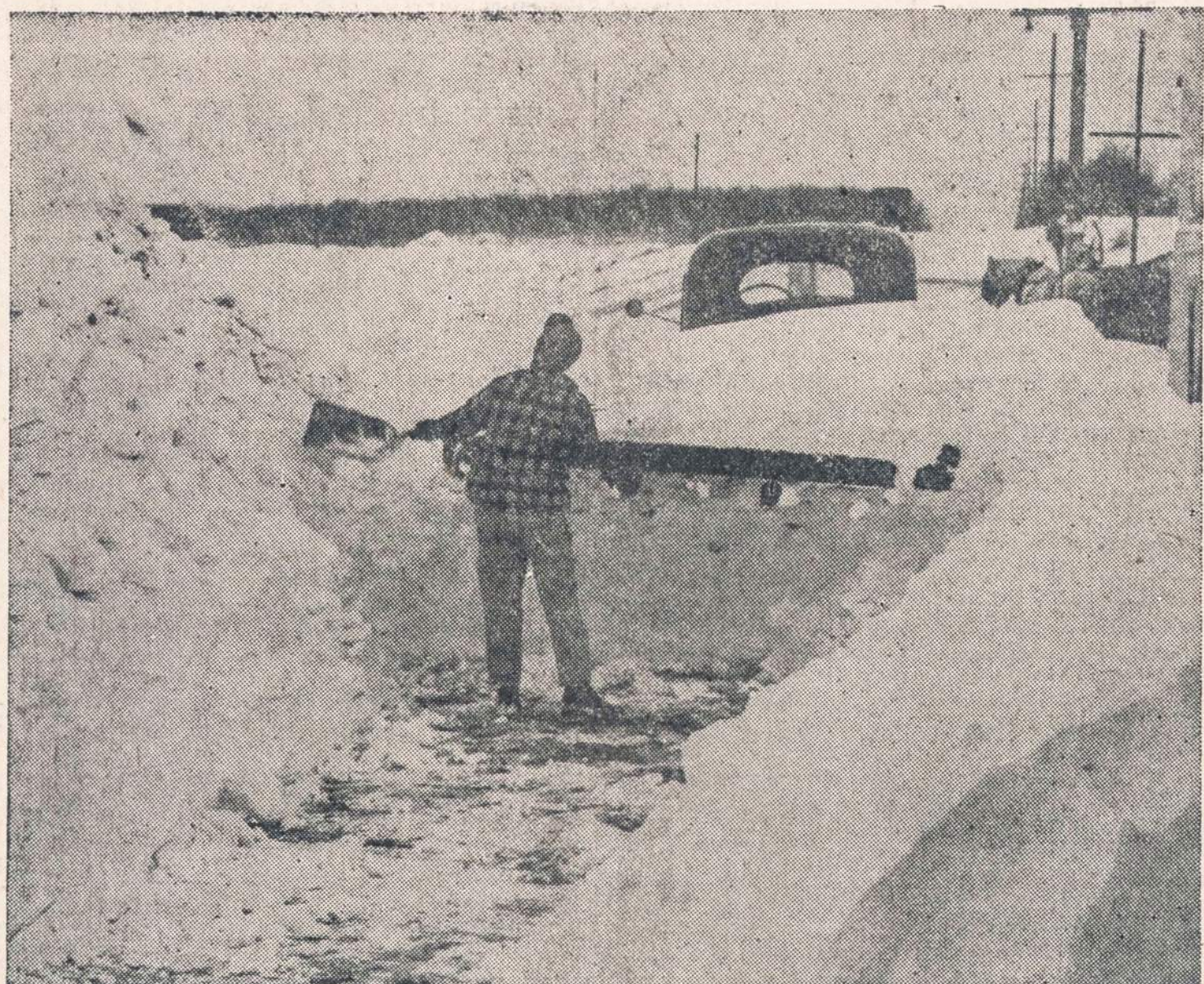
South Dakotos farmeris netoli nuo Sioux Falls bando atkasti sniego užverstą savo troką. Prieš porą dienų čia siautė viena didžiausių sniego audrų.