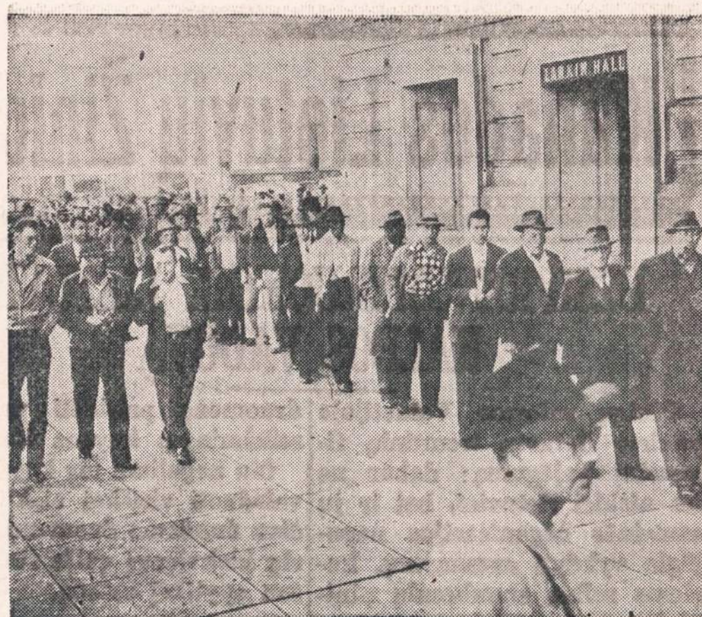
Streikuoją CIO krovėjai renkasi į San Francisco auditoriją, kur jie nubalsavo baigti 87 dienų streiką ir priimti naują kontraktą.

Atdara kasdien nuo 9 ryto iki 5 vak. Trečiad., nuo 9 ryto iki 12 diena. Ketvirtad., nuo 9 ryto iki 8 vak. Šeštad., nuo 9 ryto iki 2 pp.