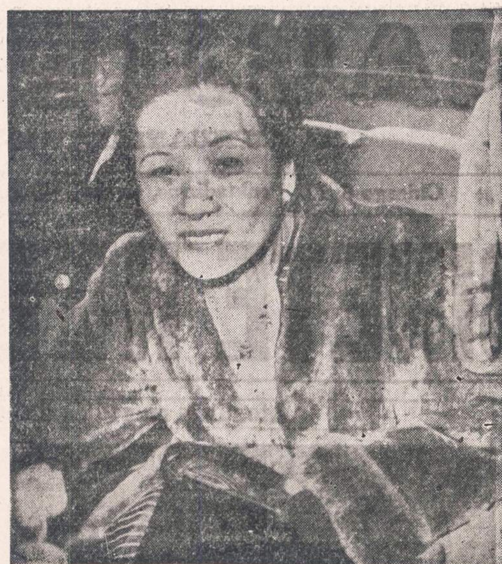
Madame Chiang Kai-Shek, Kinijos prezidento žmona, atskrido į San Francisco. Jos misija — gauti didesnę paramą iš Amerikos.