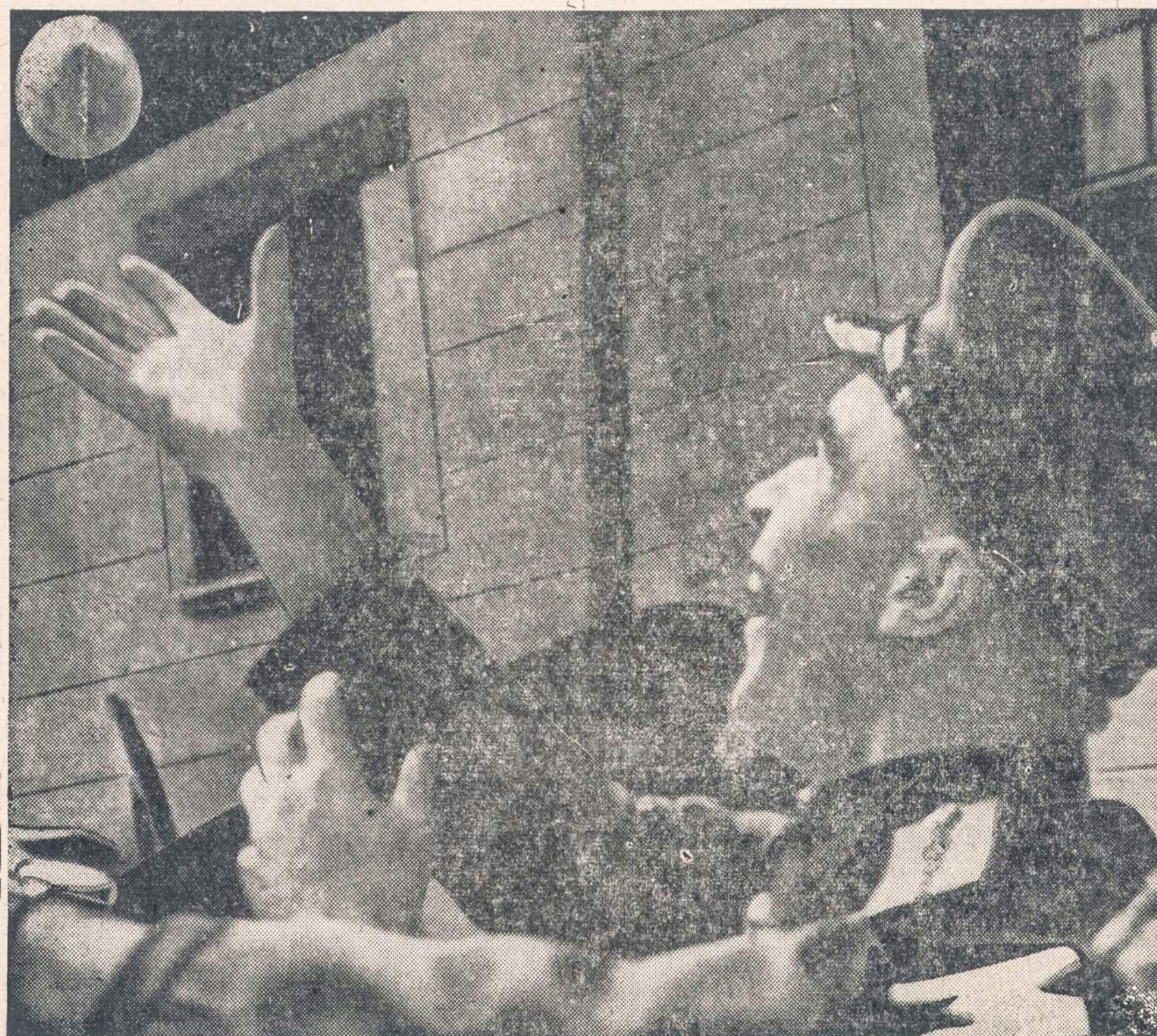
Dillingeno stovyklon atvažiuojus rusus tremtiniai apmėtė kiaušiniiais ir supuvusiomis tomatomėm, o vėliau apdaužė ir išvarė. Pradžioje sovietų karininkas bandė sučiupti jį paleistą kiaušini, bet kai daugiau pradėjo lėkti, tai pabėgo. Rusai paliko propagandas, lietuviai visus sovietų spaudinius sudegino.