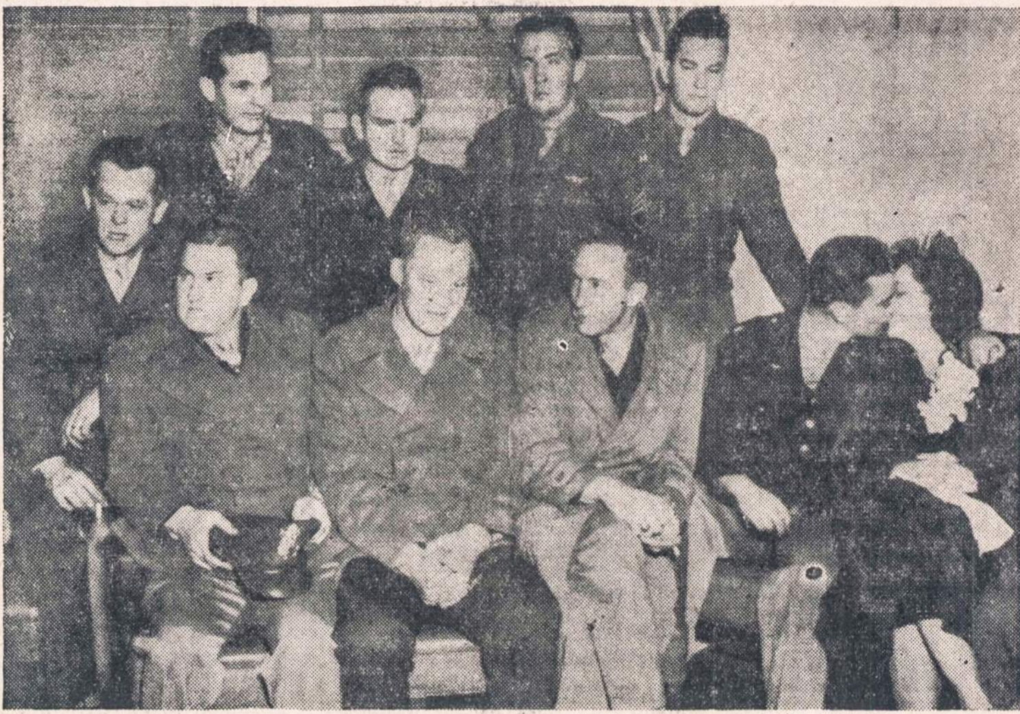
Lakūnai ir technikai, kurie dalyvavo Grenlandijoje nukritusio lėktuvo igulos išgelbėjime.