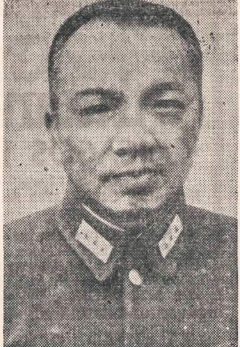
Maršalas Li Chi-Sen, politinis Chiang Kai-Shek'o oponentas, apleidė Sanchajų ir išvyko į šiaurinę Kinijos dalį, kur jis rengiasi susitikti su komunistų lyderiais.

Konstitucijos parašėjas pasakė: "Vyriausio Lietuvos Išlaisvinimo Komiteto priimtas projektas." Be to, yra žinoma, kad kalbamasis projektas yra priimtas dviem skaitymais ir patiekta visiems lietuviams, kad jie galėtų jį apsvarstyti ir patiekti savo pastabų bei pataisų. Po to jau jis bus priimtas trečiuoju skaitymu ir, kaip parlamentinėje praktikoje priimta, gaus įstatyminę galią.