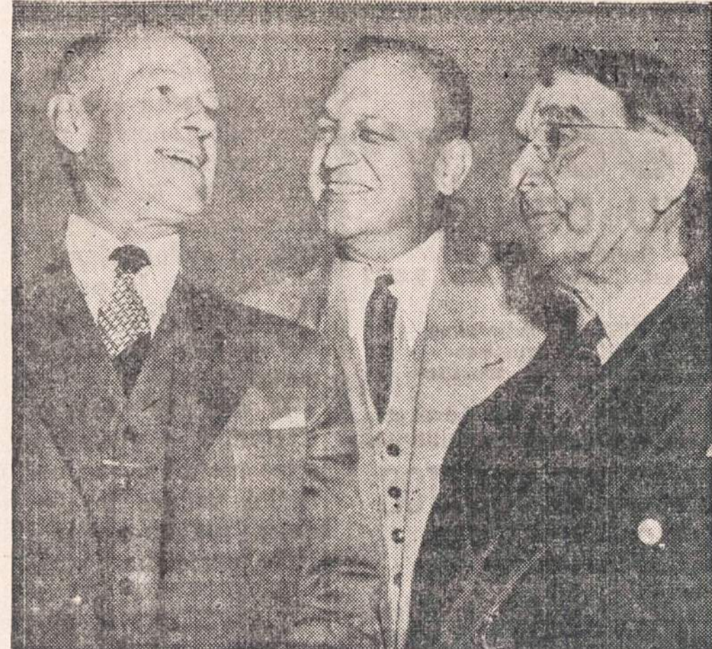
Demokratų senatoriai susirinko į Washingtoną pasitarti dėl pareiškimo vadovybės iš republikonų. Sen. Millard Tydings (kairėje), sen. Scott W. Lucas ir sen. Kenneth McKeller.

Gali būti, kad taip ir bus. Visi drausmingi ir solidarūs tremtiniai, o taipgi, gal, daugumas senųjų emigrantų VLIKo pakelbiniai PLB konstitucijai paklus. Tačiau VLIKui vis dėl to ne pro šalį turėti galvoje tą faktą, kad jis veikia ne savo valstybėje, kurioje priimtąjį įstatymą turėtų priimti ir patiekti savo pastabų bei pataisų. Po to jau jis bus priimtas trečiuoju skaitymu ir, kaip parlamentinėje praktikoje priimta, gaus įstatyminę galią.