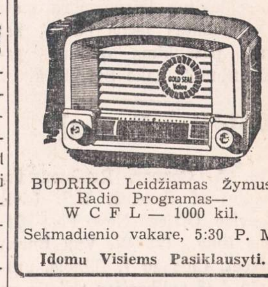
BUDRIKO Leidžiamas Zymus Radio Programas—W C F L — 1000 kil. Sekmadienio vakare, 5:30 P. M. Idomu Visiems Pasiklausyti.

UŽKVIEČIA— Visus atsilankyti į DIDŽIULI SAUSIO MENESIO ISPARDAVIMĄ.—RAKANDU, RADIO, TELEVISION SETŲ, ELEKTRINIŲ ŠALDYTUŲ, SKALBIA MŪMASIŲ, RASOMŲ MASINĖLIŲ, REKORDŲ, JEWELRY — DAIMONTŲ, LAIKRODELIŲ. VISKAS PARSIDUODA NUZEMINTOMIS KAINOMIS.