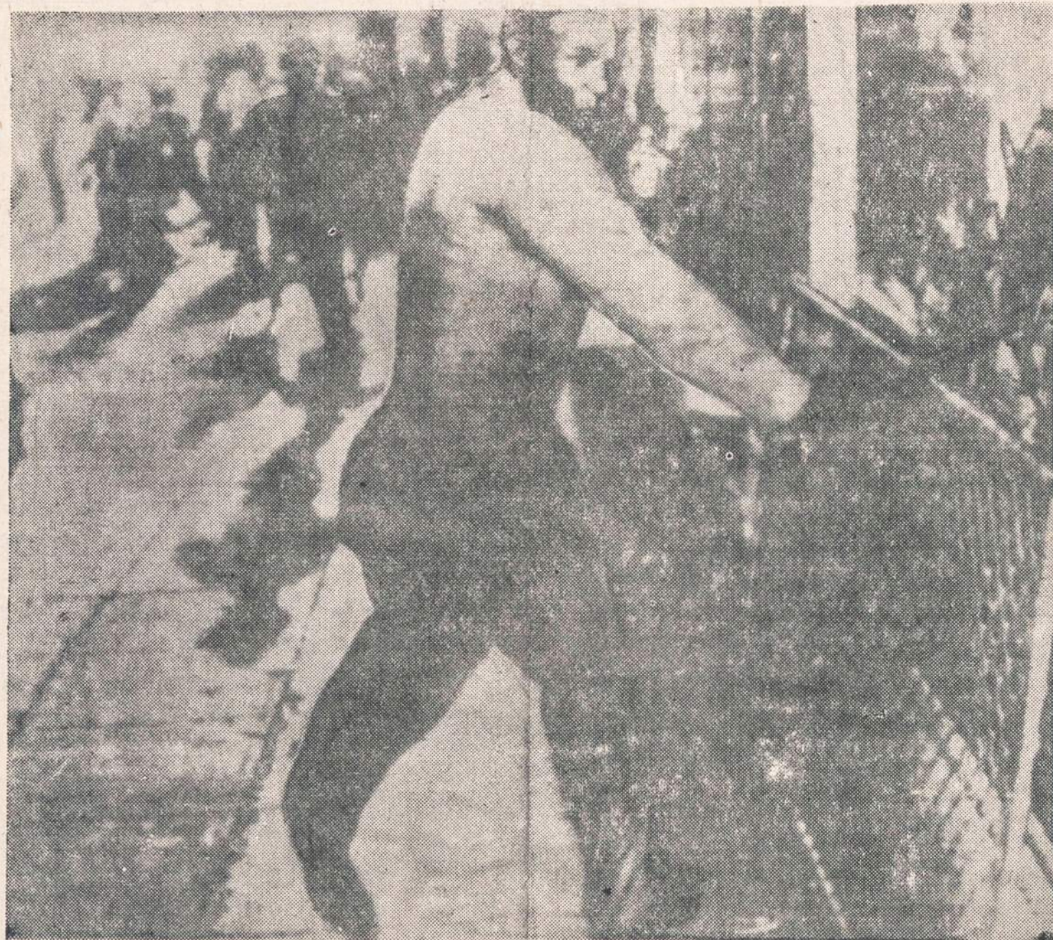
DURBAN, PIETU AFRIKA. — Kruvinos riaušės, kuriose iki šiol buvo užmušta ir sužeista 1,075 žmonių. Vietiniai išdaužė indus krautuvų bei namų langus. Po to tarp vietinių ir indus kilo kruvinas susirėmimas.