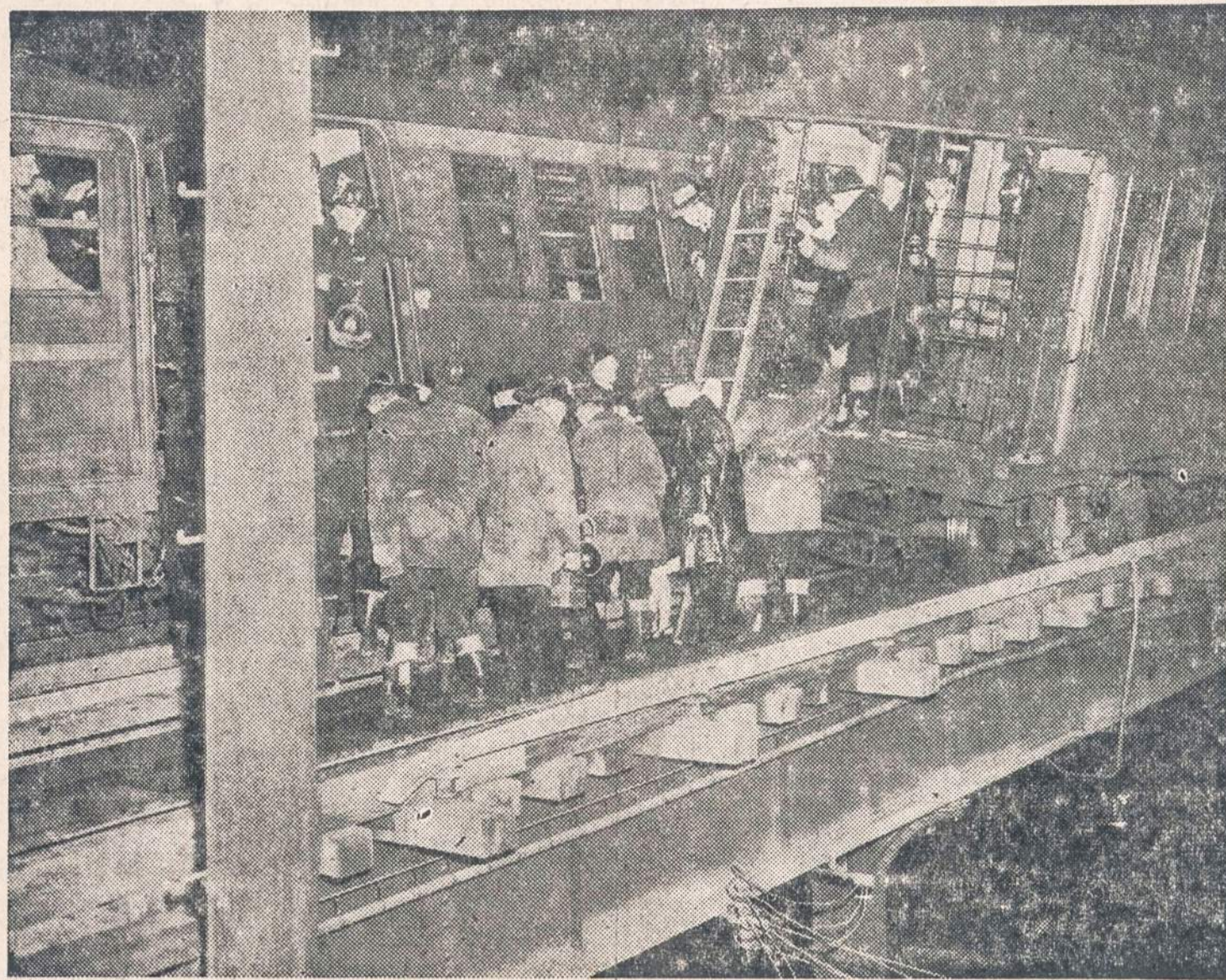
Chicago iškeltasis traukinys beveik neapvirkto. Pasazieriams buvo nemažai baimės, tačiau niekas nenukentėjo.