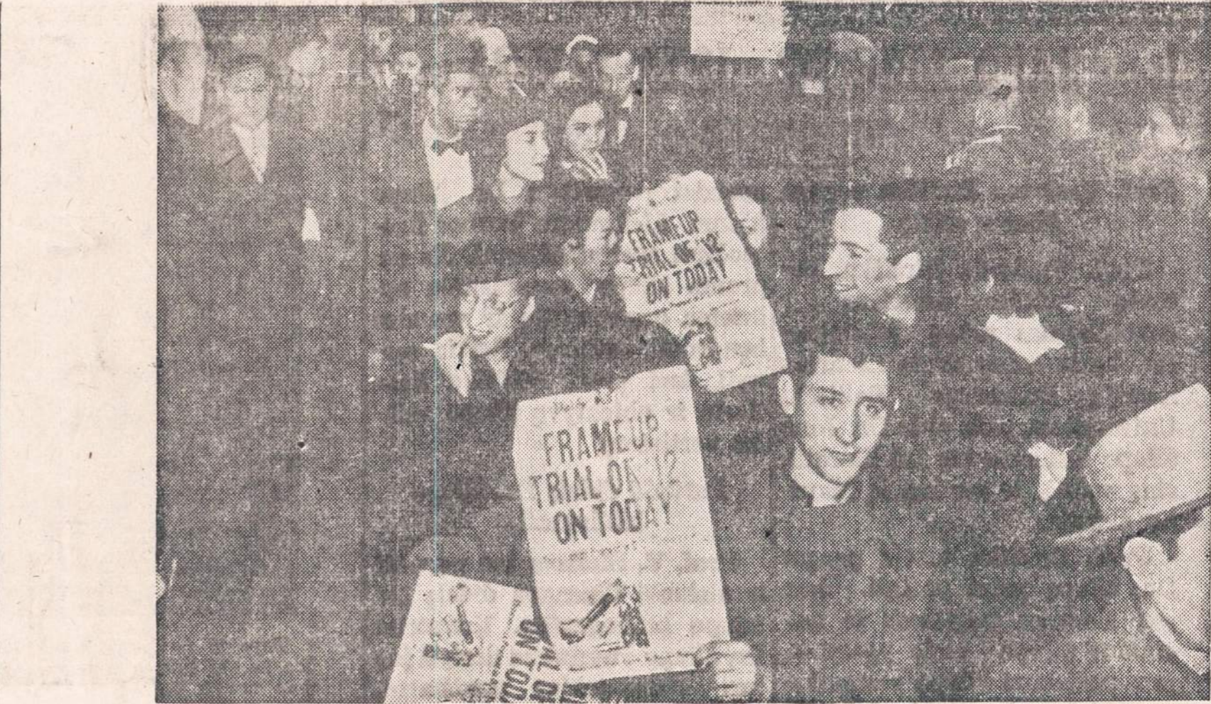
Komunistų suagutuoti pikietininkai prie Federalio teismo trobesio New Yorke, kur prasidėjo komunistų vadų bylos nagrinėjimas.

Lenkijoje. Bet prancūzai, belgai ar olandai, kurie padėjo žydams, mažiau teturėjo bijoti savo kaimynų už tokios pagalbos suteikimą, taip pat buvo ir su Skandinavijos kraštų tautomis. Tai viena priežastis, kodėl tradiciškai demokratinuose Vakarų Europos kraštuose išlikusių gyvy žydy skaičius buvo dešimt — penkiolika kartų didesnis, kaip kad Lenkijoje, Lietuvoje ar Latvijoje.