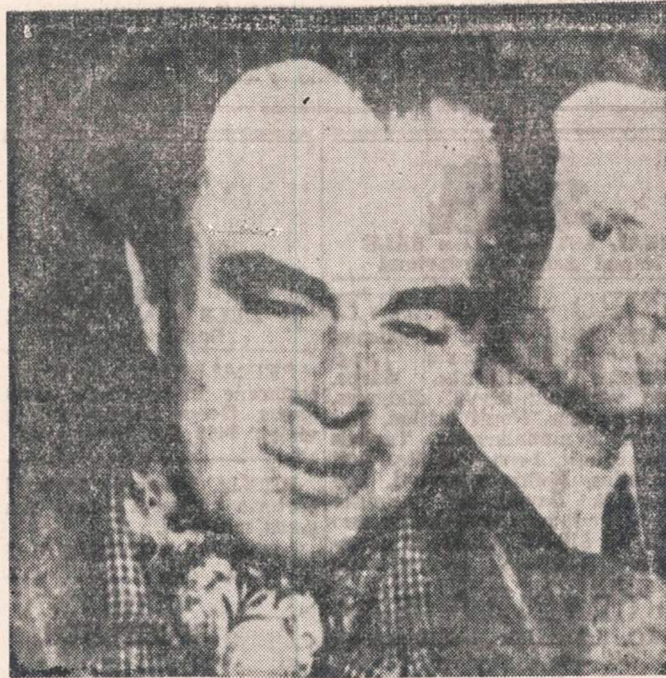
Princas Aly Khan, iš Indijos, kuris rengiasi vesti kino aktorę Ritą Hayworth.