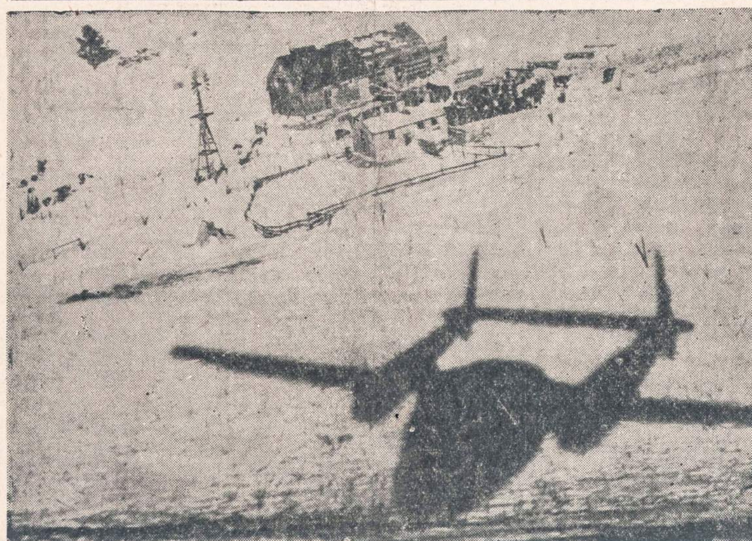
Lėktuvai veža šieną kalnuose užpastvintiems šalantiems galvijams. Kairėje, virš lėktuvo šėlio, matytis išmesti šieno ryšuliai. Daugiau negu 6,000 svarų šieno išmetė Taylor, Nebraska, srityje atskirtiems galvijams.