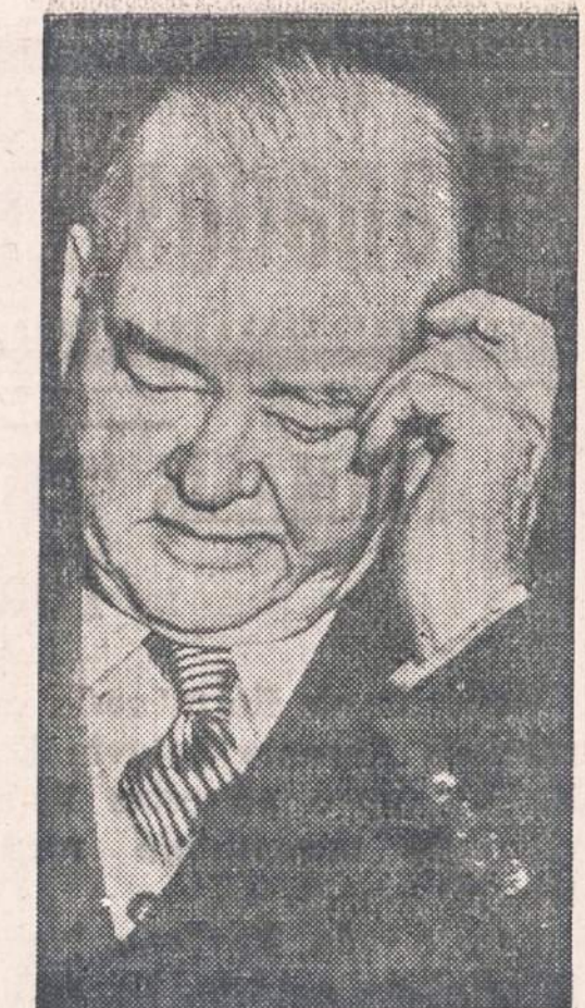
Buvęs prez. Herbert Hoover Indija atstovų rūmų komitetui. Jis patarė duoti prezidentui didelę galią valdžios įstaigoms pertrarkyti. Jei kongresas nepadarys tokio nutarimo, tai kraštai bus padaryti dideli nuostoliai.