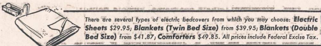
There are several types of electric bedcovers from which you may choose: Electric Sheets $29.95; Blankets (Twin Bed Size) from $39.95; Blankets (Double Bed Size) from $41.87; Comforters $49.85. All prices include Federal Excise Tax.

Jeigu jūs norite pasijusti taip žvalus, kaip žiogelis kiekviena rytą... jūs pamėgsite miegojimą po elektriniu užklodu, comforter arba paklode.