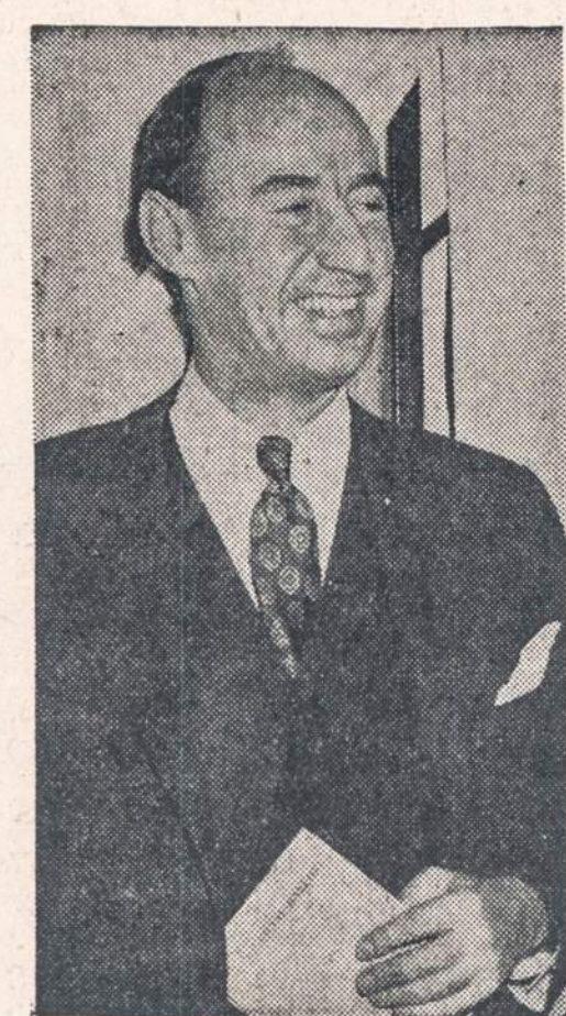
Illinois gubernatorius Adlai E. Stevenson

Daugumos lyderis laiškė sako, kad jis tai noriai pada- rsysiąs.