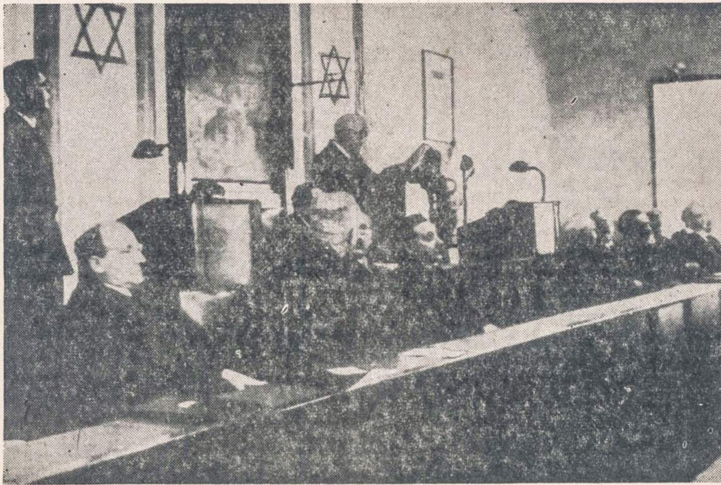
Dr. Chaim Weizmann, provizoris Izraelio prezidentas (stovi viduryje), kalba į Izraelio parlamentą, kuris tik šiomis dienomis buvo išrinktas.