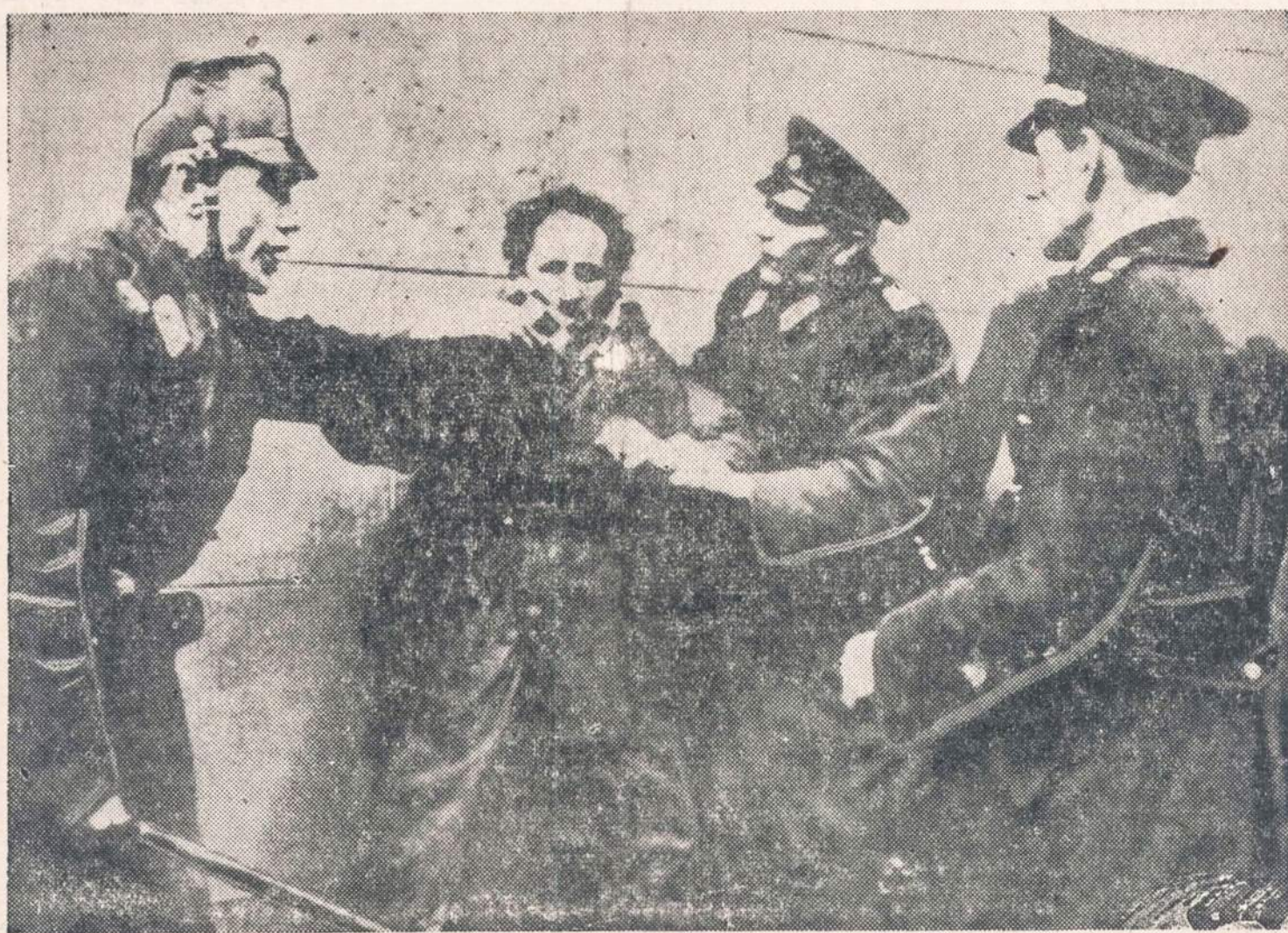
Vokiečių policija malšina žydus, kurie protestuodami susirinko prie kino teatro. Tame teatre buvo rodomas filmas „Oliver Twist“, kurį žydai laiko antisemitiniu.