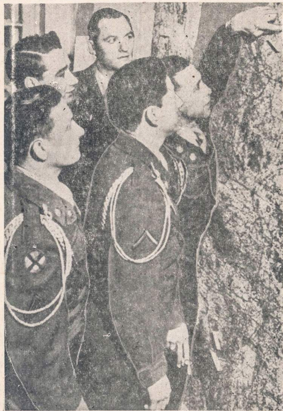
Amerikos kapų registravimo komisijos nariai apėjo Meek-lenburgą (Vokietijoje), kuris randasi sovietų zonoje, ir atvyko į Berlyną.