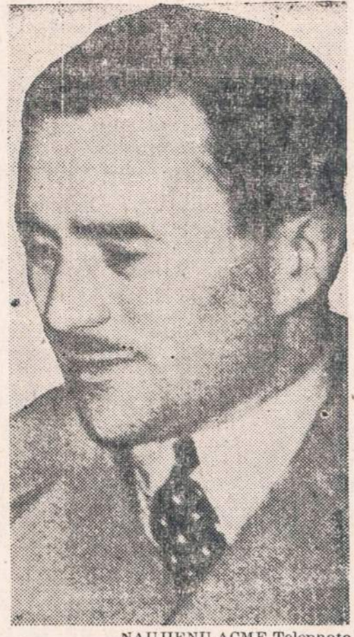
John George Haigh, kuris tapo areštuotas Londone, Skelbiamas, kad jis nužudęs sesis žmones ir geres jų kraują lyg kognis vampyras.