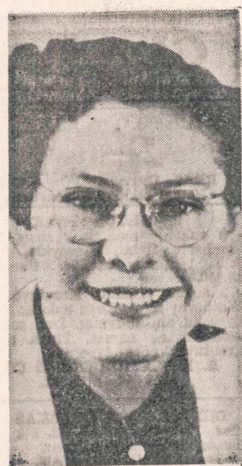
Grand Delphine Downing Lawson, Mich. — Iškamas namų rūšyje. Raymond Fernandez ir Martha Beck prisipažino ją nužude.

tuosius atgal į Lietuvą; ir grąžinti visų prieš suėmimą turėtų turtą bei darbą;