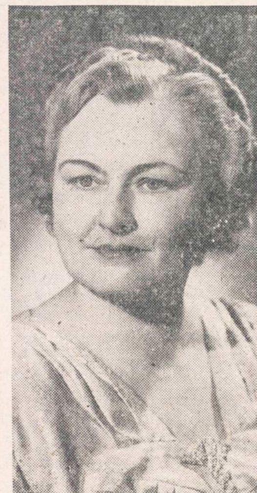
ELZBIETA KARDELIENE, sopranas, operos solistė