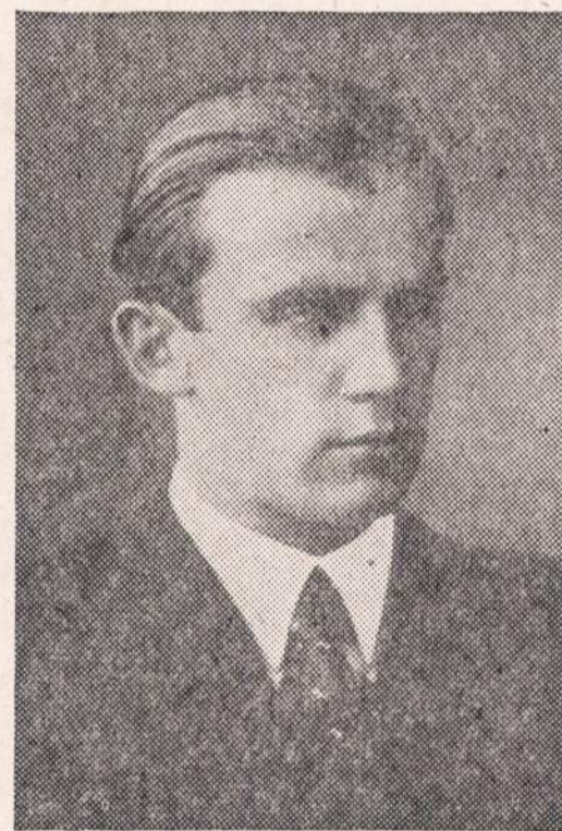
VYTAUTAS GORINAS, "rimtas ir nerimtas" dainininkas.