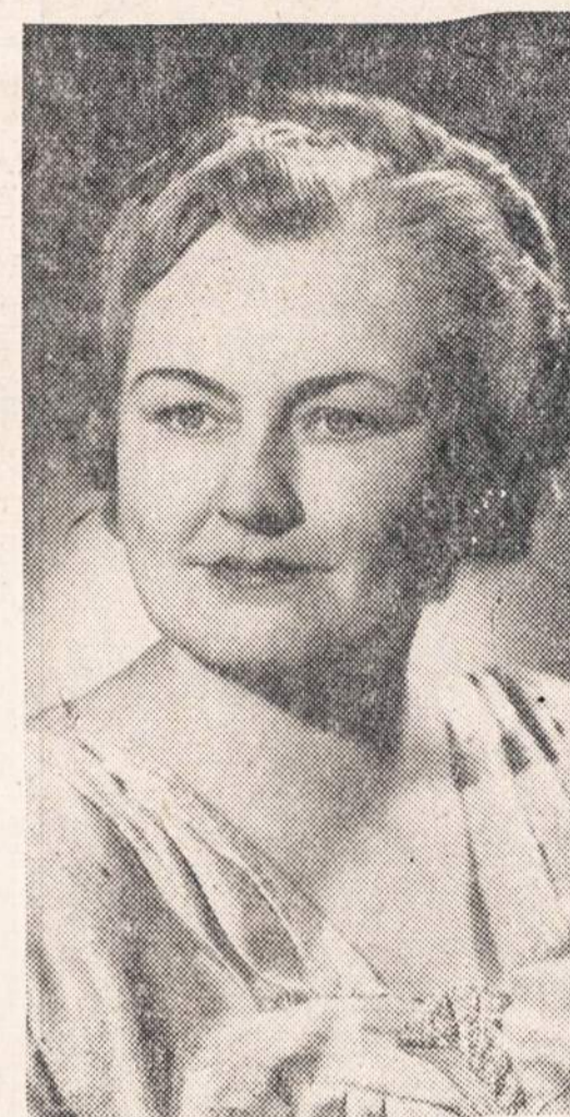
ELZBIETA KARDELIENĖ, Lietuvos operos solistė.