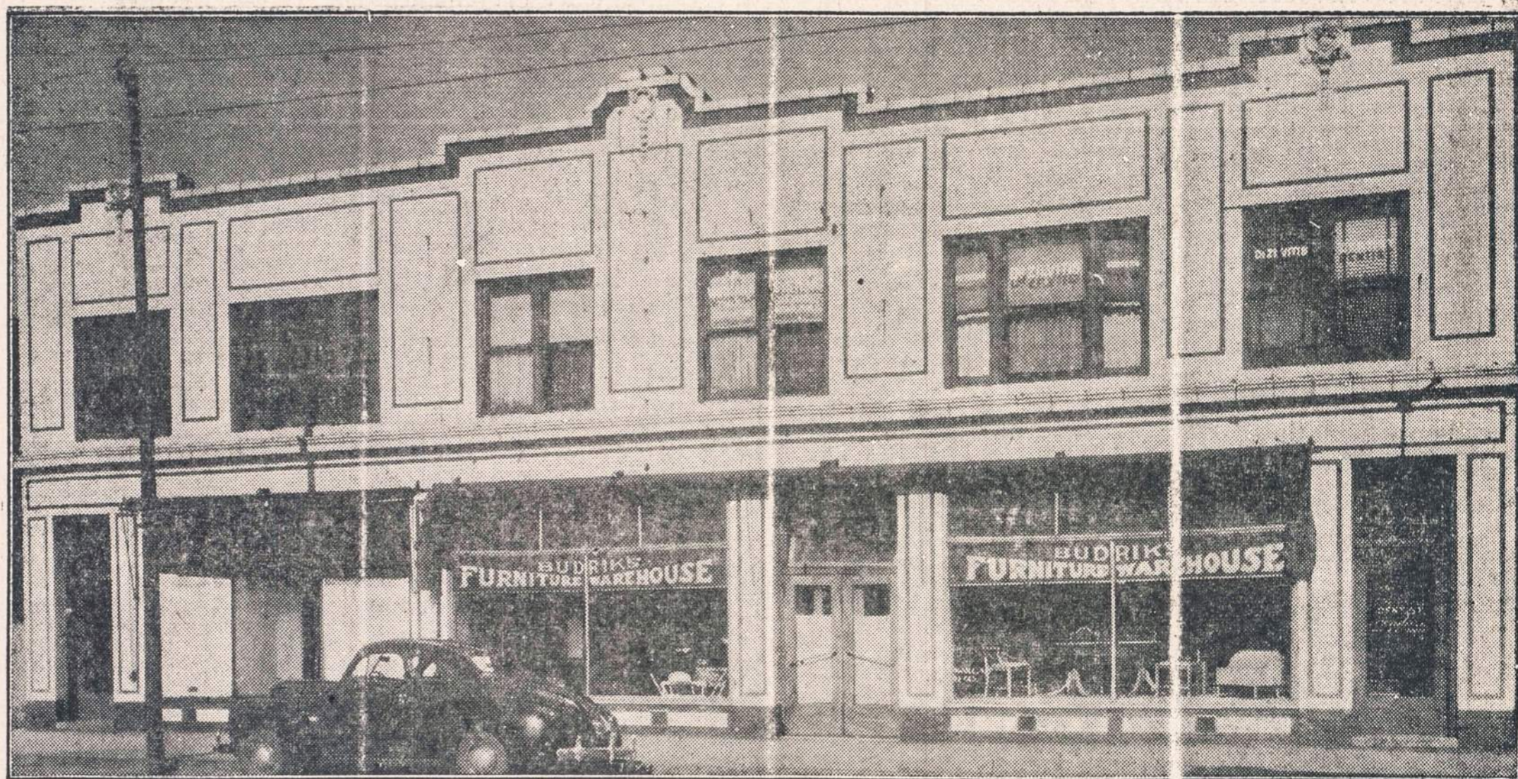
JOS. F. BUDRIKO RAKANDŲ KRAUTUVĖS NAMAS