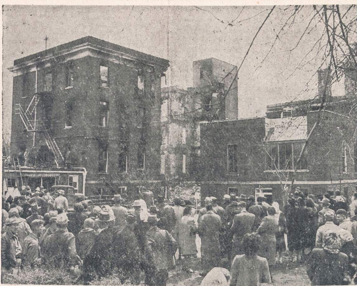
Mažame Effingham, Ill., miestelyje sudegė katalikų užlaikoma St. Anthony ligoninė, nelaimės metu žuvo 58 asmenys. Ugniagesiai ir kareiviai neša laukan lavonus ir bando juos atpažinti. Valdžia nutarė ištirti gaisro priežastis.

vo Raudonojoje Armijoje, karo metu jie buvo patekę į suomių nelaisvę.