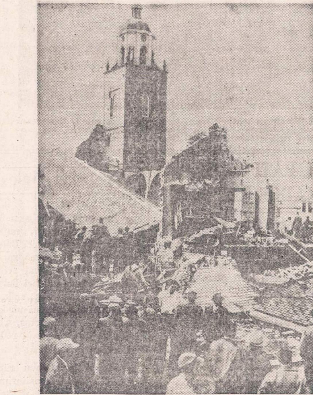
MARION, S. D., miestelyje sudegė katalikų bažnyčia. Nešalimė įvyko ma'du metu, 6 asmenys neteko gyvybės, 50 sužeisti, daugelis jų nuvežti i ligonines.