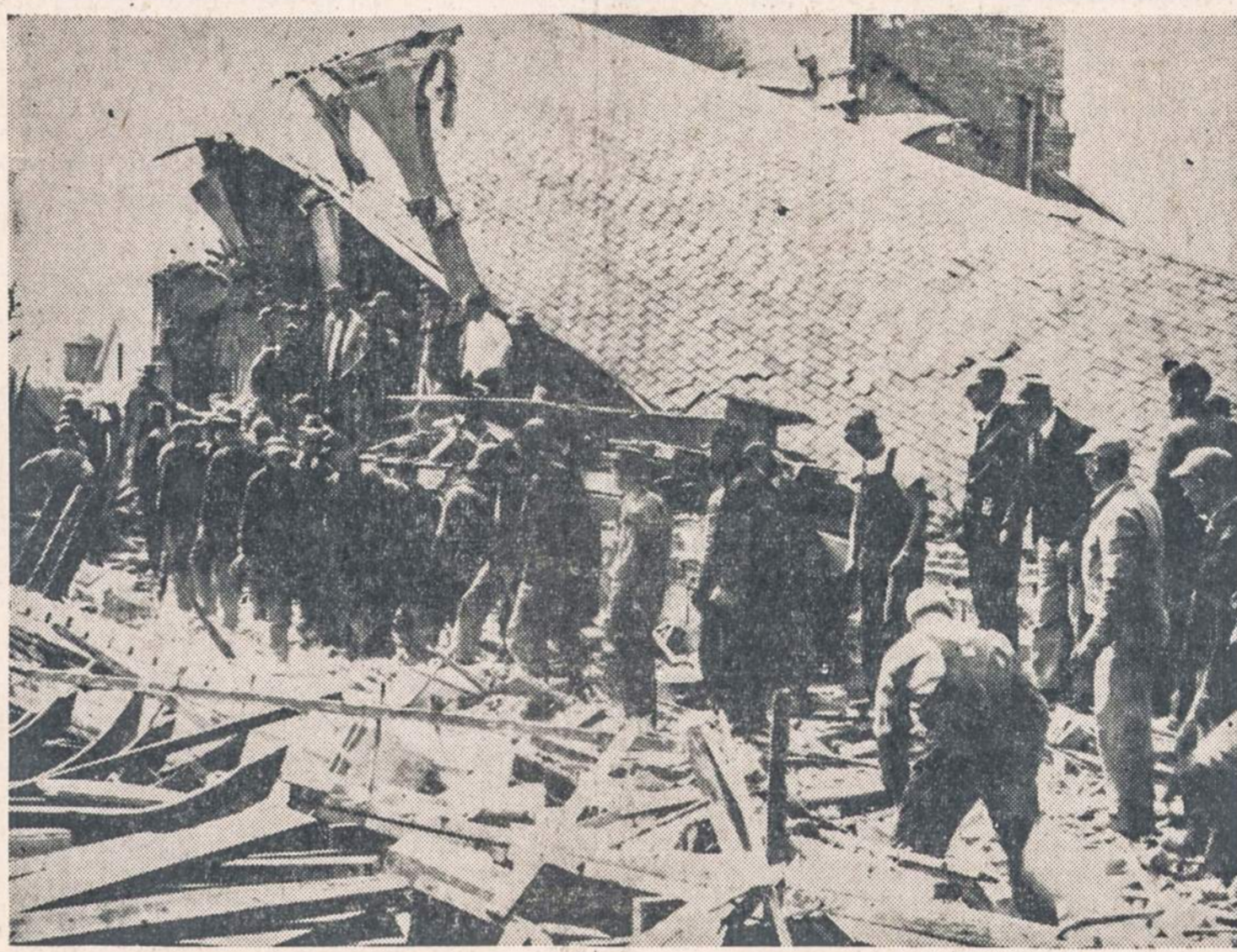
Manoma, kad pečiaus neprižiūrėjimas sukėlė Marion, S. D., bažnyčios gaisrą. Ugnagesiai bažnyčioje meldėsi, bet gaisras ją visą sunaikino. Šeši žuvo pačioje bažnyčioje, o 47 išvežti į ligoninę.