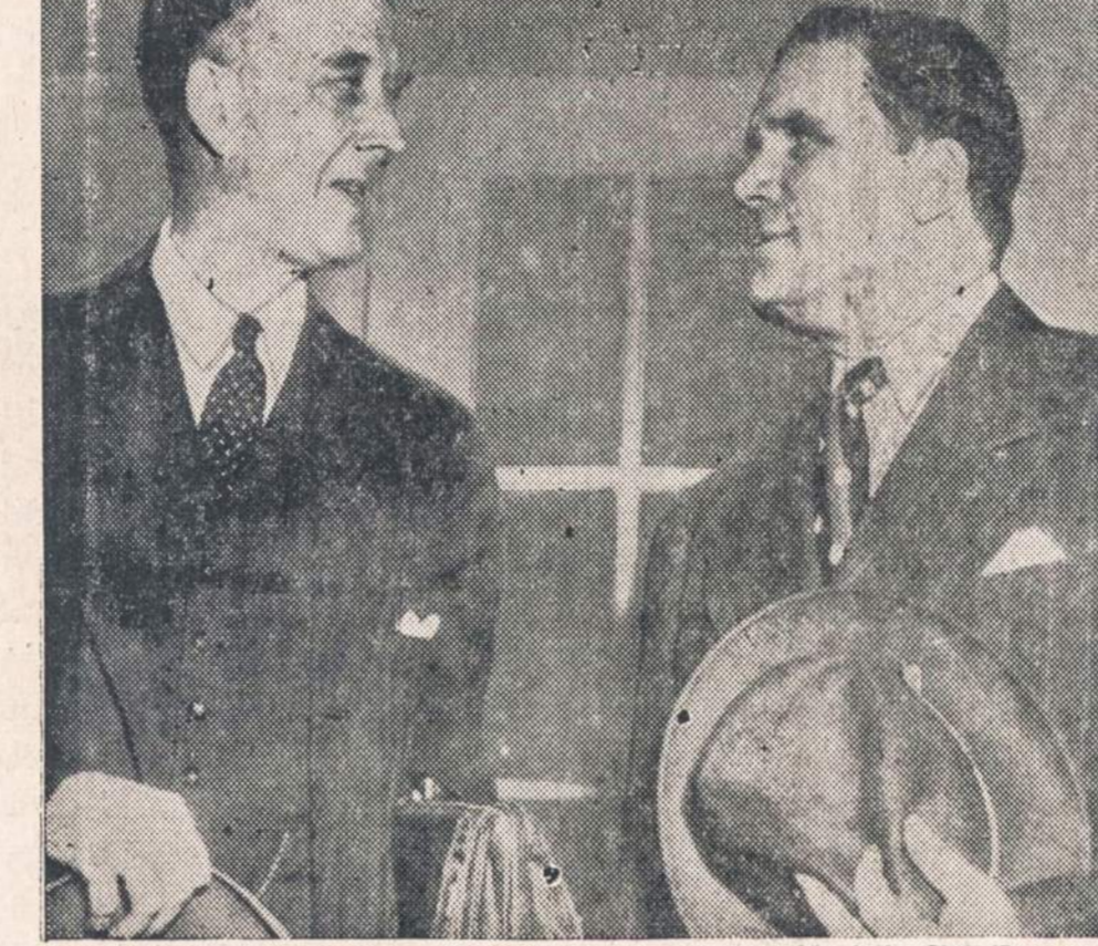
Dr. Philip Jessup, J. Valstybių atstovas saugumo taryboje, ir valstybės sekretoriaus pavaduotojas James E. Webb išėina iš Baltųjų Rūmų. Jiedu gana ilgai kalbėjosi su prezidentu Trumanu apie pasitarimus Berlyno blokadai atšaukti. Išėjęs iš Baltųjų Rūmų, Dr. Jessup pareiškė laikraščiniams, kad jis veda pasitarimus su sovietų atstovu Jakob Maliku dėl Berlyno blokadės ir kitų Vokietiją liečiančių klausimų.