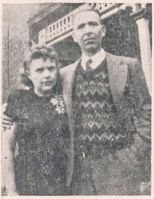
VINCUI IR VERAI TREIGIAMS

Jų vedybinio gyvenimo sidabrinio jubiliejaus proga mūsų širdingiausi linkėjimai.