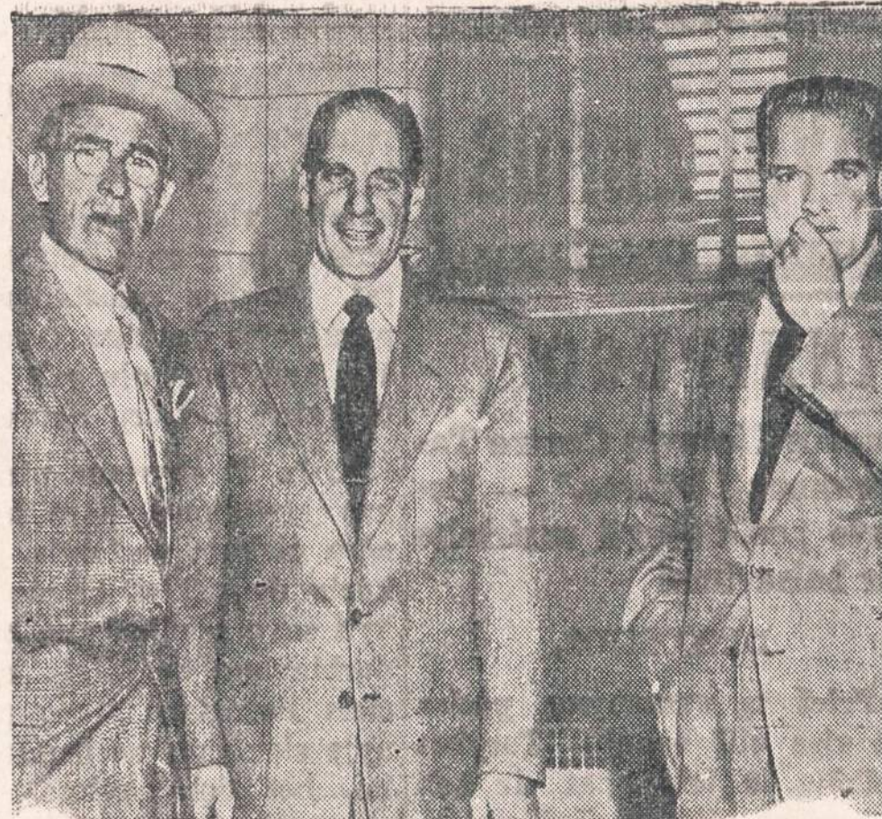
60,000 Fordo darbininkų tikrai eidami iš darbo patyrė, kad unijos vadovybė nutarė pradėti streiką gegužės 4. Vėliau streikas buvo atidėtas viena dienai. Jei nepavyks susitarti, tai šiandien sustos darbas didelėse dirbtuvėse.

SKAITYKIT IR KITUS RAGINKITE SKAITYTI "NAUJIENAS"