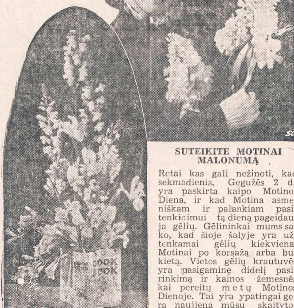
SUTEIKITE MOTINAI MALONUMĄ

Retai kas gali nežinoti, kad sekmadienis, Gegužės 2 d., yra paskirta kaip Motinos Diena, ir kad Motina asmeniškai ir palankiam pasitenkinimui tą dieną pageduotą gėlių. Gėlininkai mums saiko, kad šioje šalyje yra užtenkamai gėlių kiekvienai Motinai po korsaža arba buketą. Vietos gėlių krautuvės yra pasigaminę didelį pasirinkimą ir kainos žemesnės kai pereinu metu Motinos Dienoje. Tai yra ypatingai gera naujiena mūsų skaitytojams šiuose kainų kilimo laikuose.