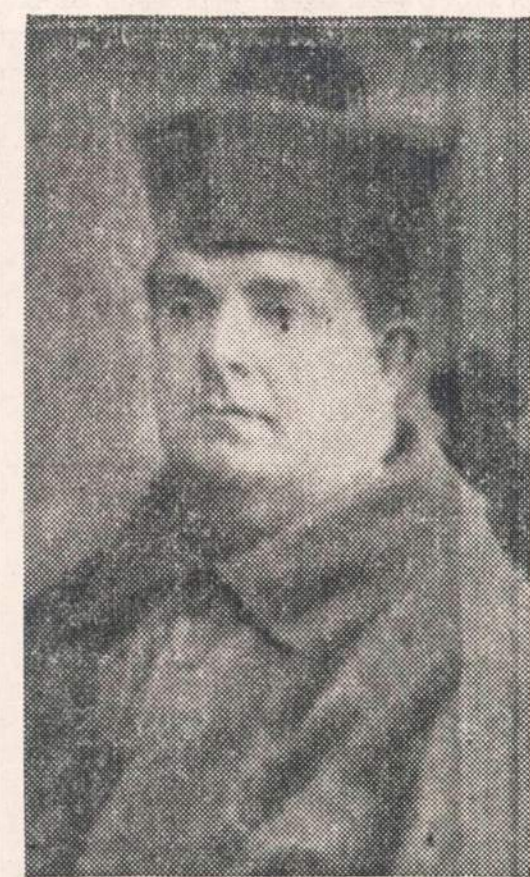
KAZIMIERAS JAUNIUS Gimė 1849 m. gegužės 6 d., mirė 1908 m. kovo 9 d.