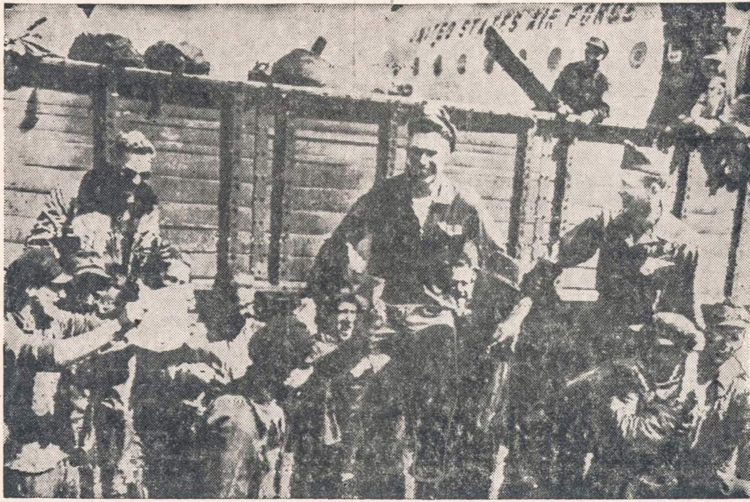
Berlyno aerodromų darbininkai, patyrę apie nutarimą atšaukti blokadą, džiaugiasi. Jie pačiuo tik ką atsikrudiję Amerikos lakūną ir kilo ją į viršų.