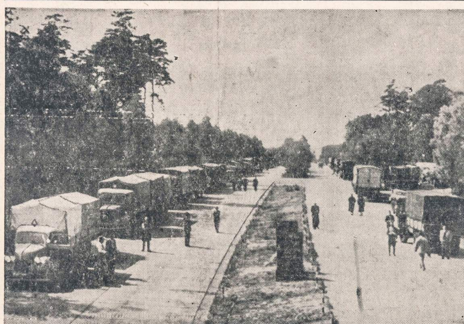
Sovietų karo vadovybė dvi dienas buvo sulaikiusi 500 automobilių su Berlynu vežamu maistu. Kada Amerikos ir britų karo vadai pradėjo protestuoti, tai rusai taip vadinamą “mažą blokadą” atšaukė. Vakar jie leido automobiliams važiuoti į Berlyną, tik tai liepė naudoti kitus plentus.