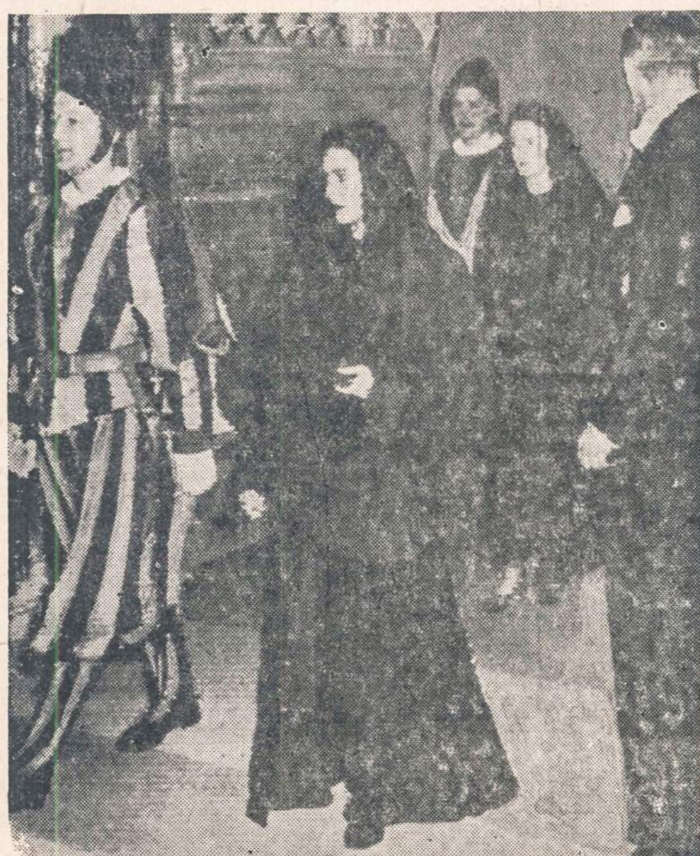
Anglijos karalaitė Margarita Rožė (centre) išeina iš Vatikano. Josios vizitas sukėlė daug plaučių komentarų, anglų karališkos šeimos nariai labai retai sustinka su popiežium.