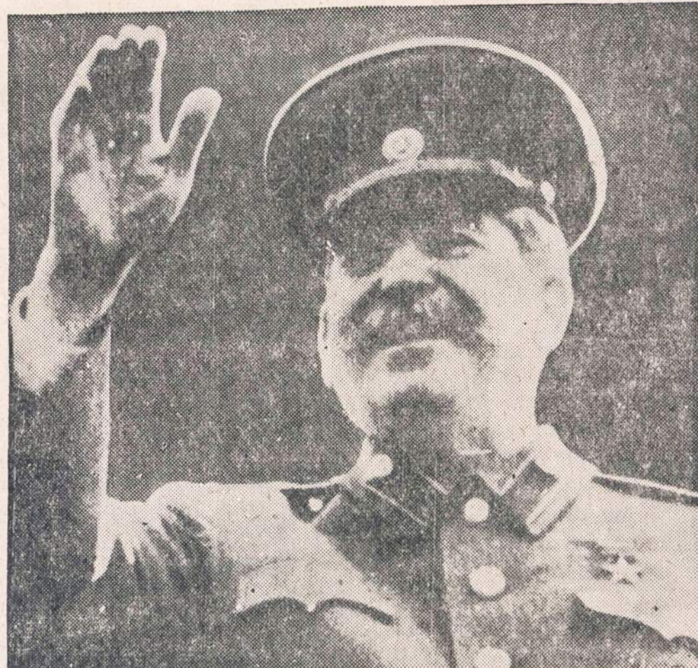
Sovietų premjeras Stalinas patenkintas Gegužio pirmą dieną pro Kremlių maršuojančia sovietų armija ir sportininkais. Tai paskutinė sovietų propagandos agentūros pagaminta fotografija.

Nemažiau kaip tris metus kandidatės "mokslinamos" visiškai uždarame izoliate, per kuriuos praeina kalbų, muzikos, dainavimo, stalo etikos, inteligencijos ir t.t. Po trijų mokslu metų NKVD pasiima jau grynai savo "mokykum", žinoma, ten kursantės mokinamos slapčiausių NKVD šnipinėjimo metodų, neužmirštant didžiausiųjų pastangų padarymū kandidačių fanatiškoms komunistų partijos narėmis! Tas daugumoje jiems ir pavyksta.