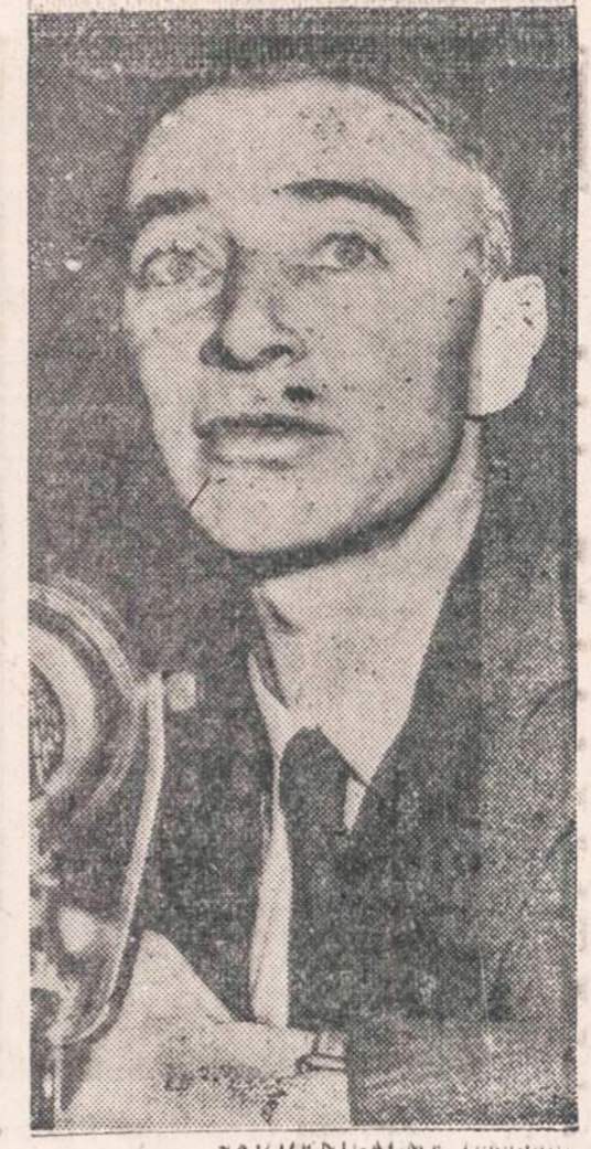
Mokslininkas J. Robert Oppenheimer budija kongreso komitete apie dabartinį atomo energijos tvarkymą. Savo laiku jis vadovavo atominės bombos gamybai. Dr. Oppenheimer tvirtina, kad užsienin siūnčiamis izotopai negali būti panaudoti prieš J. A. Valstybes.

Brangūs Detroito Lietuviai! Nežiūrint į tai, kad birželio (JUNE) 23-čią yra darbo diena, paaukokite savo poilsio laiką ir gausingai dalyvaukite. Nuo jūsų dalyvavimo priklausys ar mes sugebėsime šią dieną suorganizuoti. Sena patarlė: "Geriau duoti, negu prašyti." Šį kartą mes iš Jūsų aukų neprasome, tik paremkite mus savo atsilankymu, o aukų prašysime vėliau iš miesto visuomenės. "TAG DAY" pasisiekimas grįnau priklausys nuo Jūsų geros valios ir pasivertimo. Išidėmėtina, kad per paskutinę "TAG DAY" surinkome $5,000 su labai maža talka. Reikia pripažinti, jog Detroito visuomenė