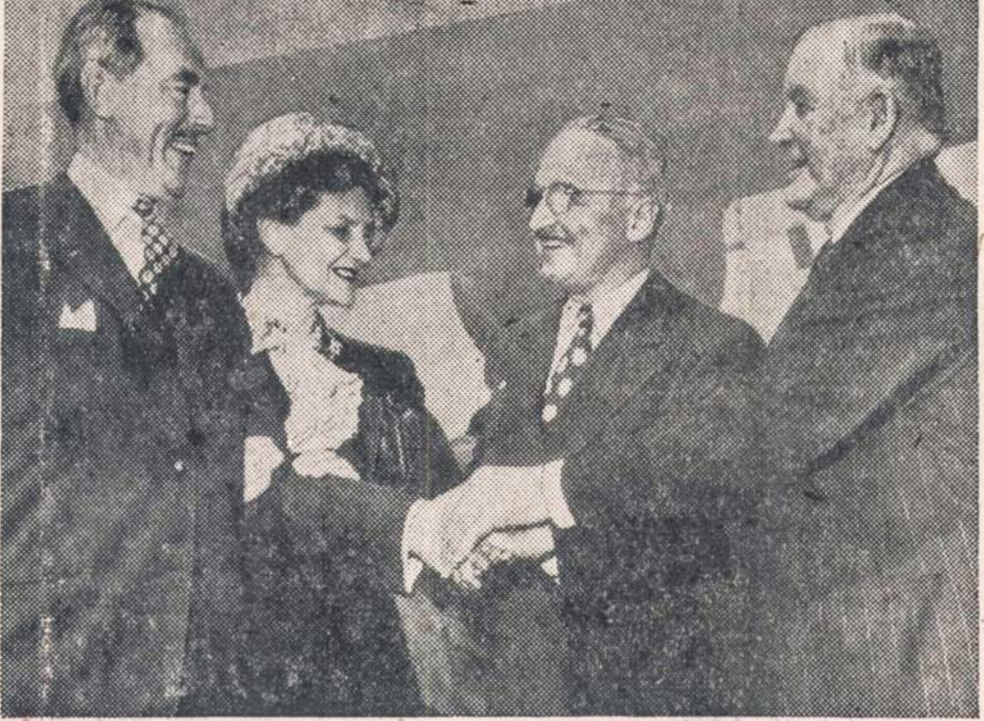
Sekretorius Dean Acheson (dešinėje), žmonos lydimas, grįžo iš Paryžiaus vykusios užsienio ministrų konferencijos. Washingtono aerodrome sekretorių sveikino prezidentas Trumanas, viceprezidentas Albn Barkley ir kabineto nariai.