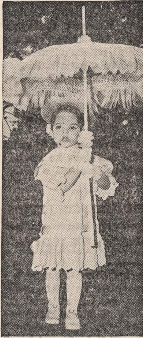
LIZA MINNELLI, two and a half year old daughter of Judy Garland and Vincente Minnelli, makes her film debut six months earlier than her famous mother. In "In The Good Old Summer-time," Liza appears as her mother's daughter, with Van Johnson as her screen father.

ir tas pasirinkimas specialistui negalėtų nesukelti šypsenos. Mat, čia nors ir yra puikūs didžiuliai miškų ir kalnų plotai ir gražių senų ūkių — pusantrio šimto metų senumo, kas Amerikai yra žila senovė — tačiau prastas susisiekimas ir nepalankios darbo sąlygos. Tą vaisybę mes buvom atostogų metu aplankę ir ji patraukė mus ne tik savo tėviškę primenan-