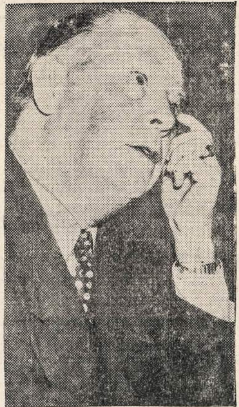
Laikraštinkas Westbrook Pegler liudija atstovų rūmų darbo subkomitete. Jis tvirtina, kad despotai, kriminalistai ir komunistai pagrobė Amerikos darbininkų profesines sąjungas savo kontrolei. Komitetas nori, kad Pegler įteiktų visas turimas informacijas.

Tremtiniams pradėjus smarkiai protestuoti, vyrai, anot belgų „iš stovyklinio režimo“ (mūsųškiai — iš kalėjimo) perkelti į internuotųjų režimą, kurį mes suprantame ne kitaip, kaip priverčiamojo darbo stovyklomis — KZ. Vyrai tebėra atskirti nuo moterų su vaikais, ir jų aplankyti neleidžiama. Moterys su vaikais pervežamos į kitą vietovę, nes Briuselyje nebesą vietos.