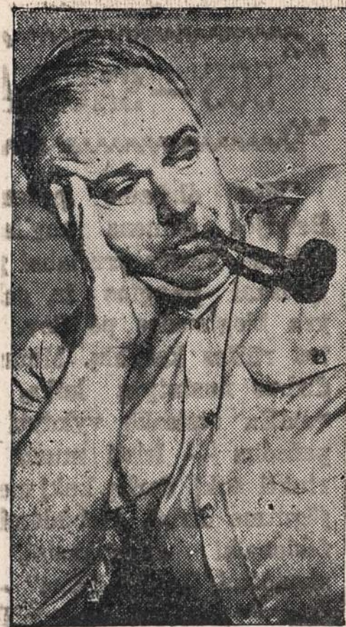
Whittaker Chambers atsisakė daryti bet kokius pareiškimus spaudai. Turint galvoje New Yorko prisiėmusį sprendimą, geriau jokių komentarų nedaryti. Chambers gyvena savo farmoje, dabar jis sieną valo.