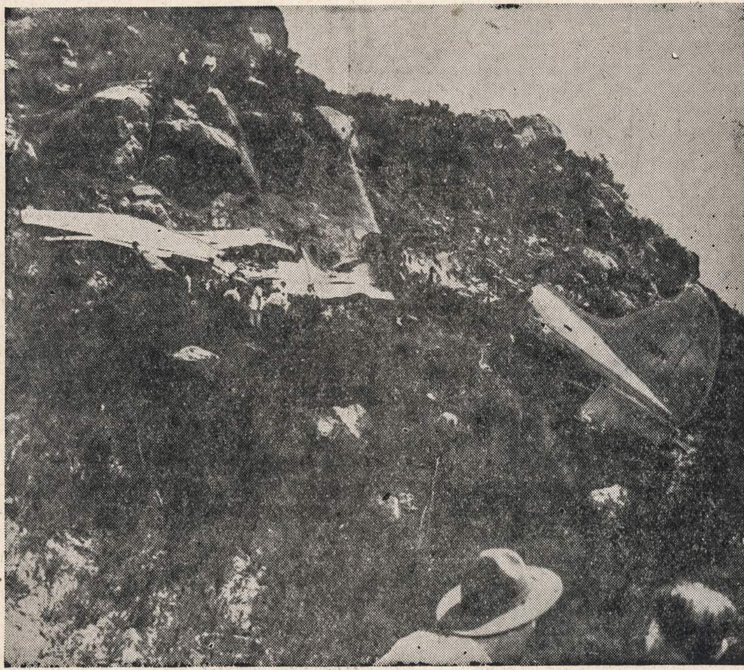
Paveiksle matome netoli Los Angeles, Cal. nukritusio ir suduzusio lėktuvo nodęga. Lėktuve buvo 42 asmenys, 13 pavyko išgelbėti, jie gydomi ligoninėse. Gyvi išlikusieji pasakoja, kad kelioms minutėms prieš nelaimę lėktuve įvyko idelės muštynės. Vienas neištuotas keleivis apdaužė savo kaimyną, o vėliau ir kiti įsivėlė į muštynes.