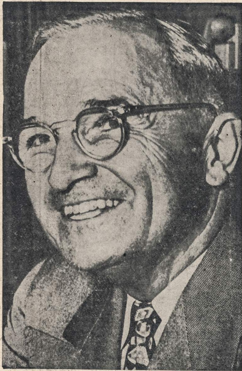
Prezidentas Trumanas vakar atvyko į Chicago, kur Soldier Field aikštėje pasakė kalbą.