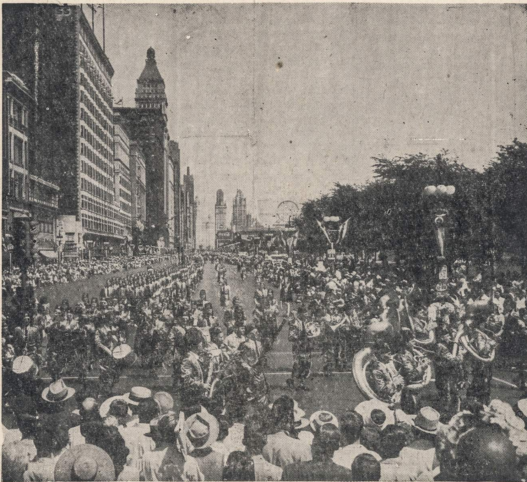
Shrieriniai maršuoja Michigan Avenue į Soldiers' Field aikštę. Tūkstančiai žmonių susirinko to parado pažiūrėti.

TOKYO, liep. 24 d. — Okina- wa tapo skaudžiai užgauta taifuno (viesulo), kuris pra- užė 125 mylių greitumu. Ame- rikos armija pasiuntė lėktuvą, kad patirtų, kas ten atsitiko, nes jokių žinių iš salos ne- gauna.