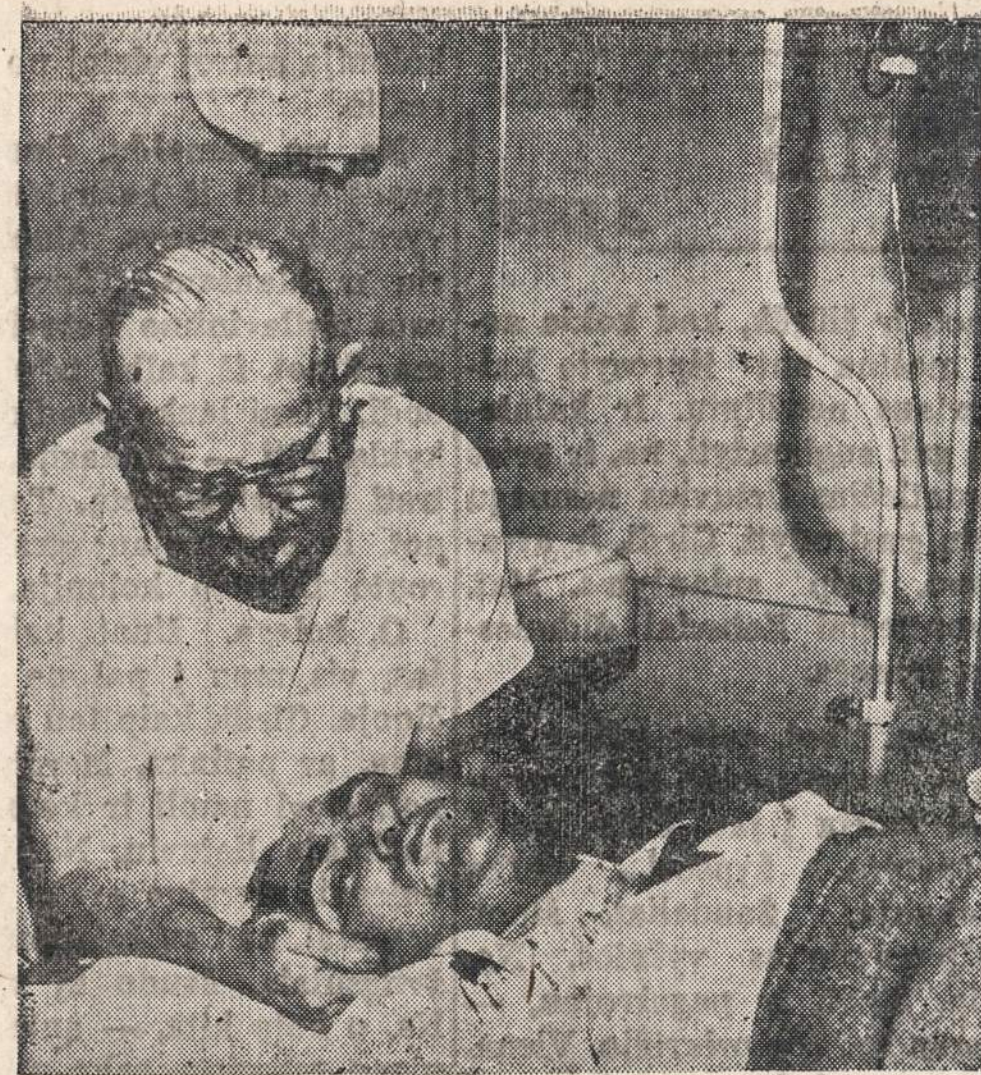
Mickey Cohen, pašautam gembleriui, Hollywood ligoninėje daro kraujo transfuziją.

Latvijoje, stambiausia "operacija" atlikta š. m. birželio mėn., kai virš 100,000 latvių