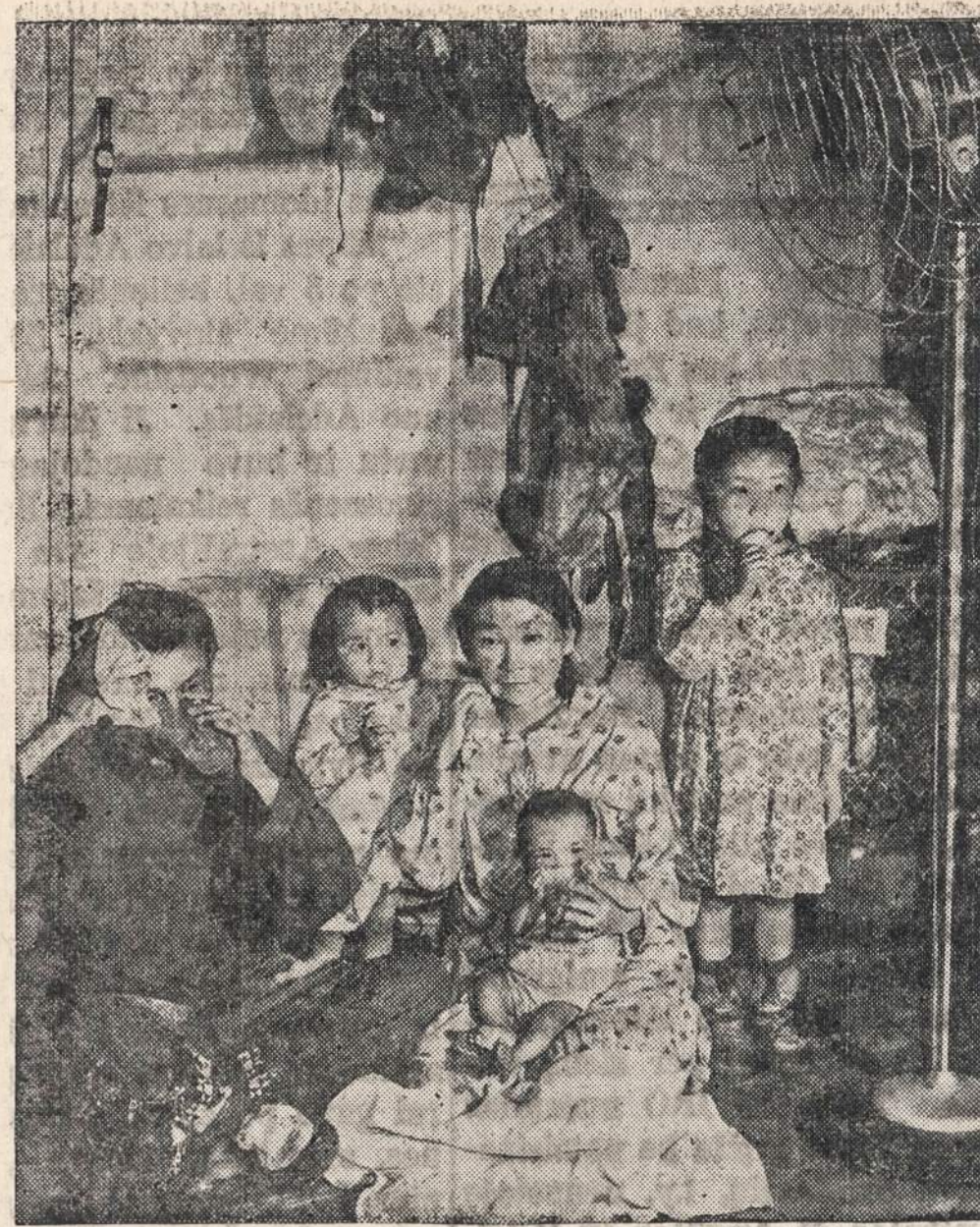
Angnaboogok šeima iš Wales (Aliaskos) patenkinta Chicago gyvenimu. Ji dalyvauja Riverview Parko perstatymo.

Tokią pareiškimą Cuddihy padarė grįžusi iš Detroito, kur ji dalyvavo mirusio Murphy laidotuvelyse.