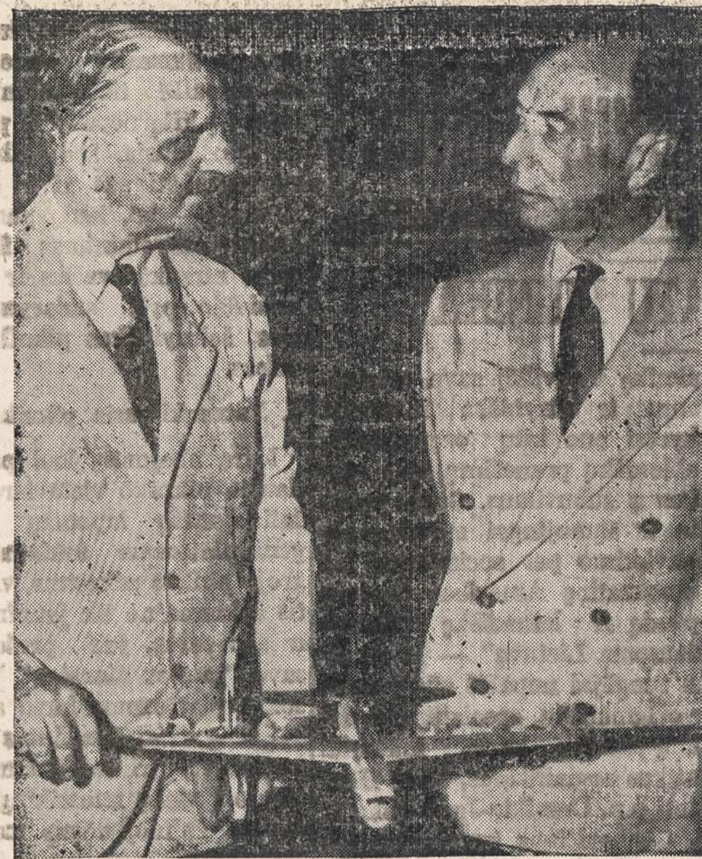
Robert A. Lovett (dešinėje), buvęs aviacijos sekretoriaus pavaduotojas, liudija kongreso komitetui apie didžiųjų lėktuvų užsakymus. Šiomis dienomis investigacijos komitetas išklauskis didaką liudininkų skaičių.

"NAUJIENAS" rašo visų srovė žmonės darbininkai, biznieri, profesionalai, avasnikai, mokslininkai ir valstybininkai.