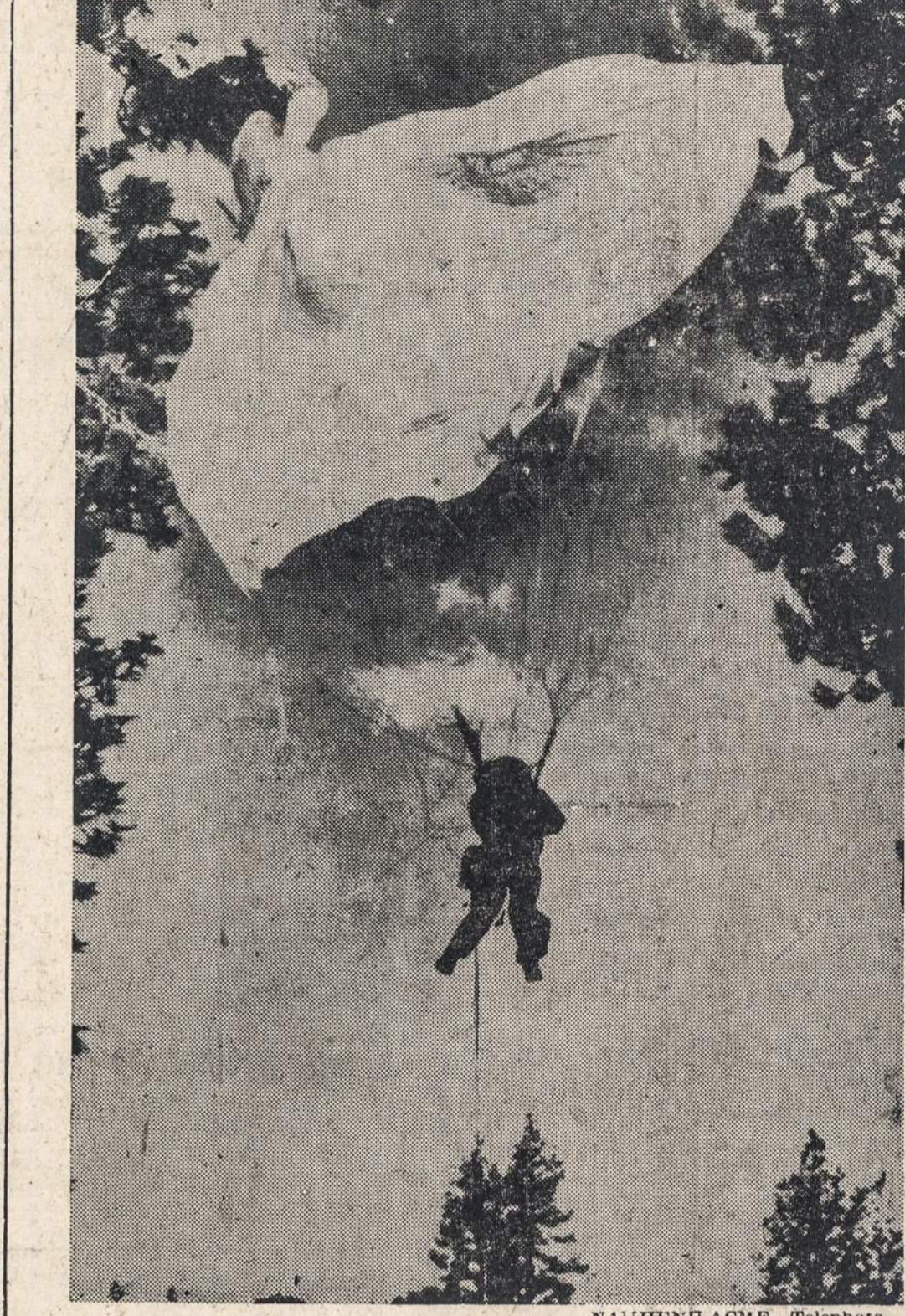
Miškininkai leidžiasi į gaisro sritį. Helena, Montana, miškuose žuvo 13 miško gestintojų.