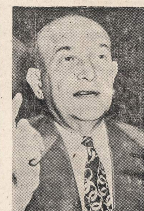
Apsaugos sekretorius Louis Johnson lūdi, kad senato investigacijos subkomitetas sekretorius priza-dėjo nuosirdžiai bendradarbiauti su senatu, kad atskratytų nevy-kusius ir neįtikinamus pareigas einančių tarnautojų.