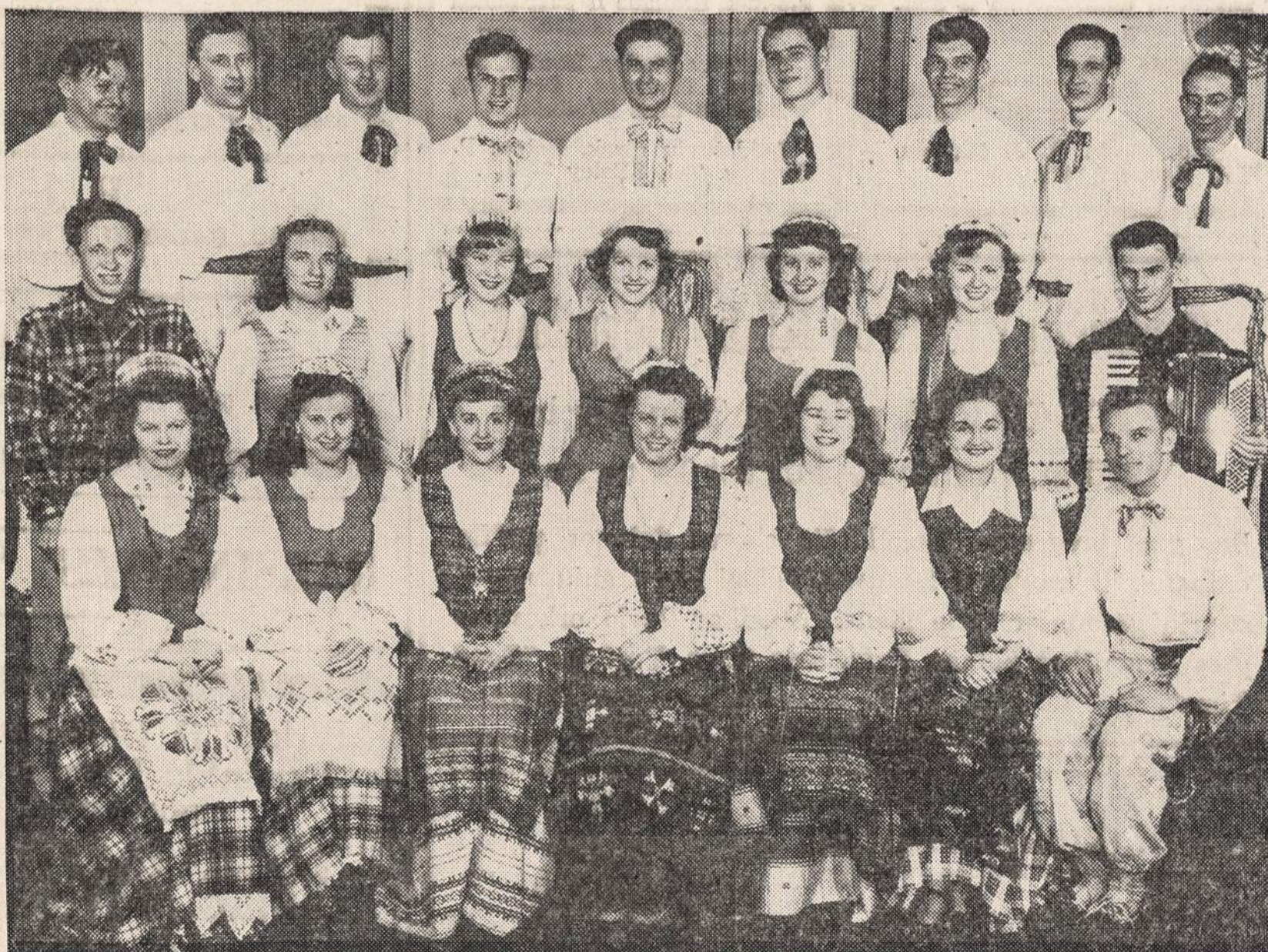
"ATEITIES" ŠOKĖJŲ GRUPE ŠOKS "NAUJIENU PIKNIKE