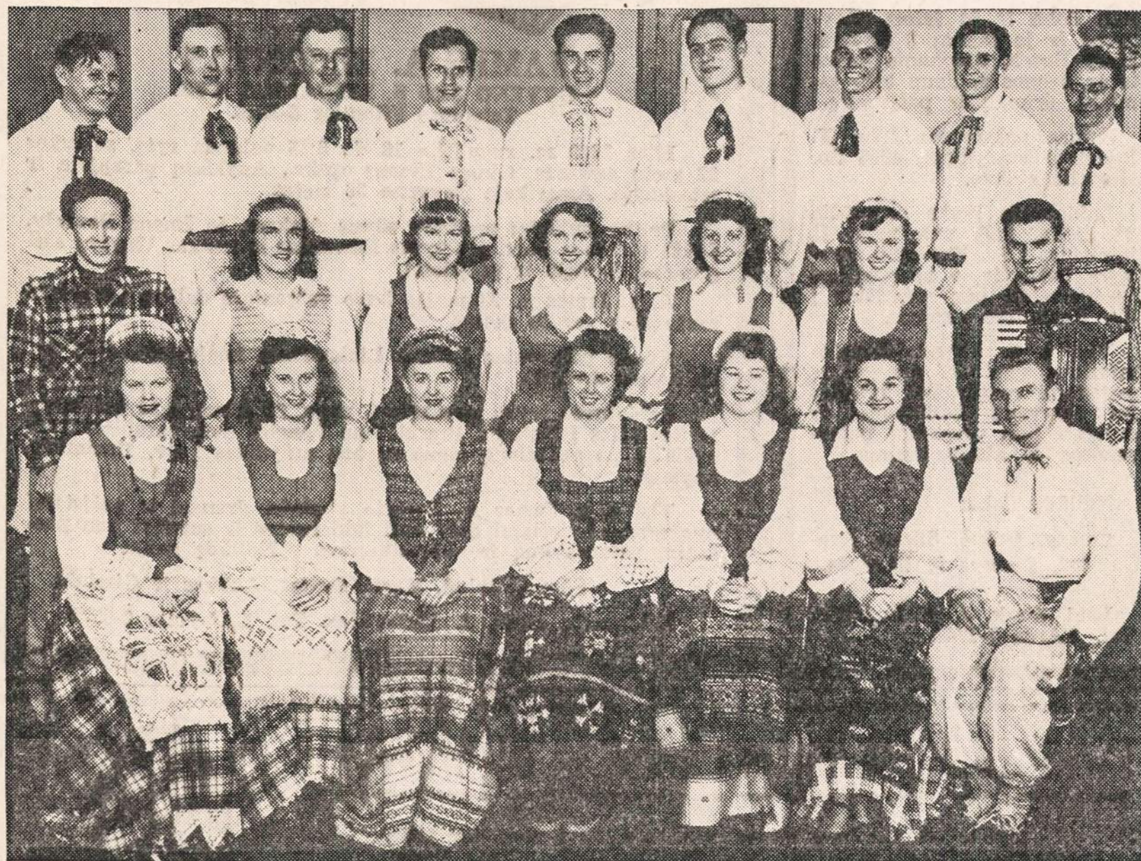
"ATEITIES" ŠOKĖJŲ GRUPĖ ŠOKS "NAUJIENŲ PIKNIKE