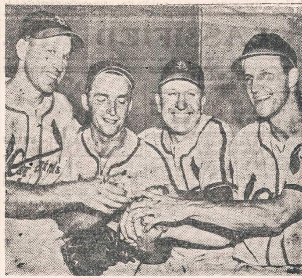
St. Louis sportininkai (Cardinals) patenkinti, kad jiems pavyko laimėti kelis lošimus. St. Louis grupė dabar stovi piama, nęvo Brooklyn Dodgers.

Viskas buvo taip sutvarkyta, kad iš Miami uosto pagalba buvo siunčiama tiesiai į Ecuadorą. Nebuvo jokių kliūčių, nes siunčiamai pagalbai nereikėjo jokių dokumentų.