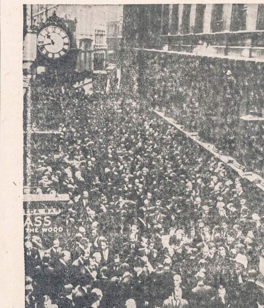
Britų valdžia nuvertinus svarą ir uždarius biržą, ties Londono birža susirinko didokas būrys žmonių, komentavo valdžios nutarimą ir spekuliuojo gavėje. Gavėje gyvai buvo parduojami vertybių popieriai ir gaudomas auksas.