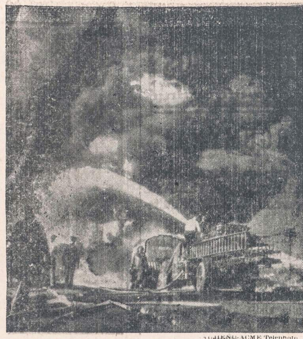
Flint, Mich., miestelyje užsidėgė gazolino atsargas. Gaisras buvo toks didelis, kad žmonės jį galėjo lengvai matyti iš 10 mylių atstumo.

"NAUJIENOS"—NEISSEMAMAS ŽINYNO IR ISMINTIES ŠALTINIS. SKAITYKITE JAS IR KITUS RAGINKITE SKAITITI IR PLATINTI