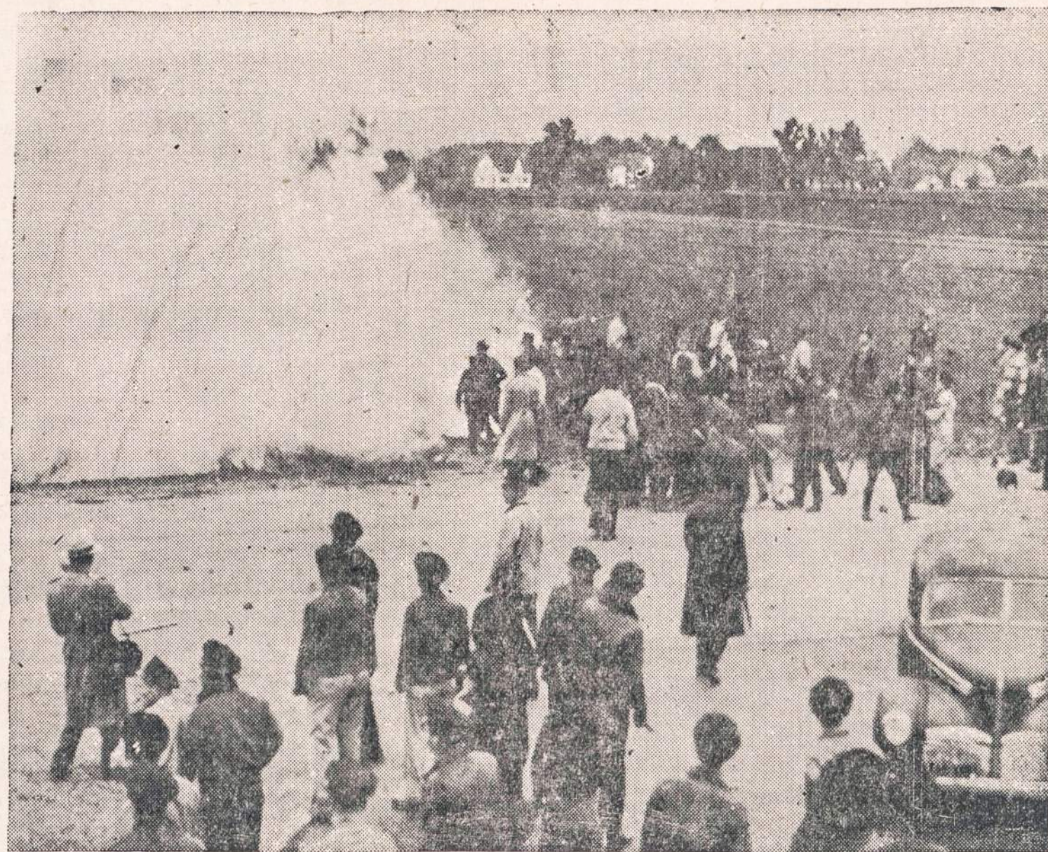
"Bell Aircraft" bendrovės darbininkai jau kelintą mėnuo streikuoja. Paskutiniemis dienomis įvyko keli susirėmimai tarp pikietininkų ir streiklaukių. Vietos serifas atsuntė policininkus tvarkai atstatyti.

Šita rintis gvyai reiškia ir per jos organo "Nepr. Lietuvos" puslapius, kuri, tinkamų rankų tvarkoma, duotose są-