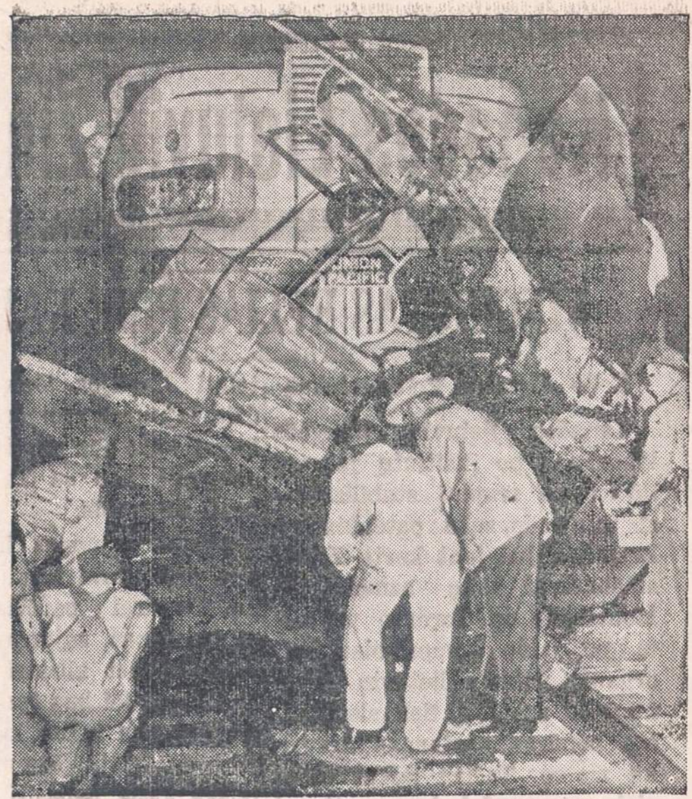
Greitai važiuojas traukinis įvažiuoja į autobusą, pravažiuojantį Ontario, Calif., kryžkelę. Darbininkai stengiasi išimti kareivio lavoną, istrigusį tarp autobuso ir garvežio.

Filipiniečių valdžia prašo JAV duoti gintis pakankamai šaudmenų gintis nuo antėjančių narlaivių. Jie nori gauti bombų, sprogstančių vandens gilumoje.