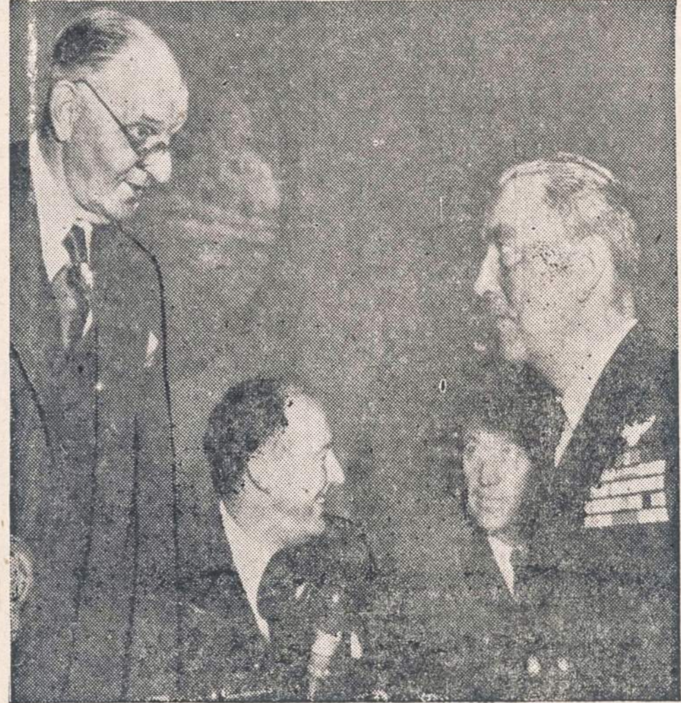
Adm. Arthur W. Radford, Pacifiko laivyno vadas, liudija atstovų rūmų karo komitetui. Komiteto pirmininkas Vinson sveikina Washingtonan iškvietą kariškį Adm. Radford tvirtina, kad negalima pasitikėti vien tik B-36 lėktuvais.