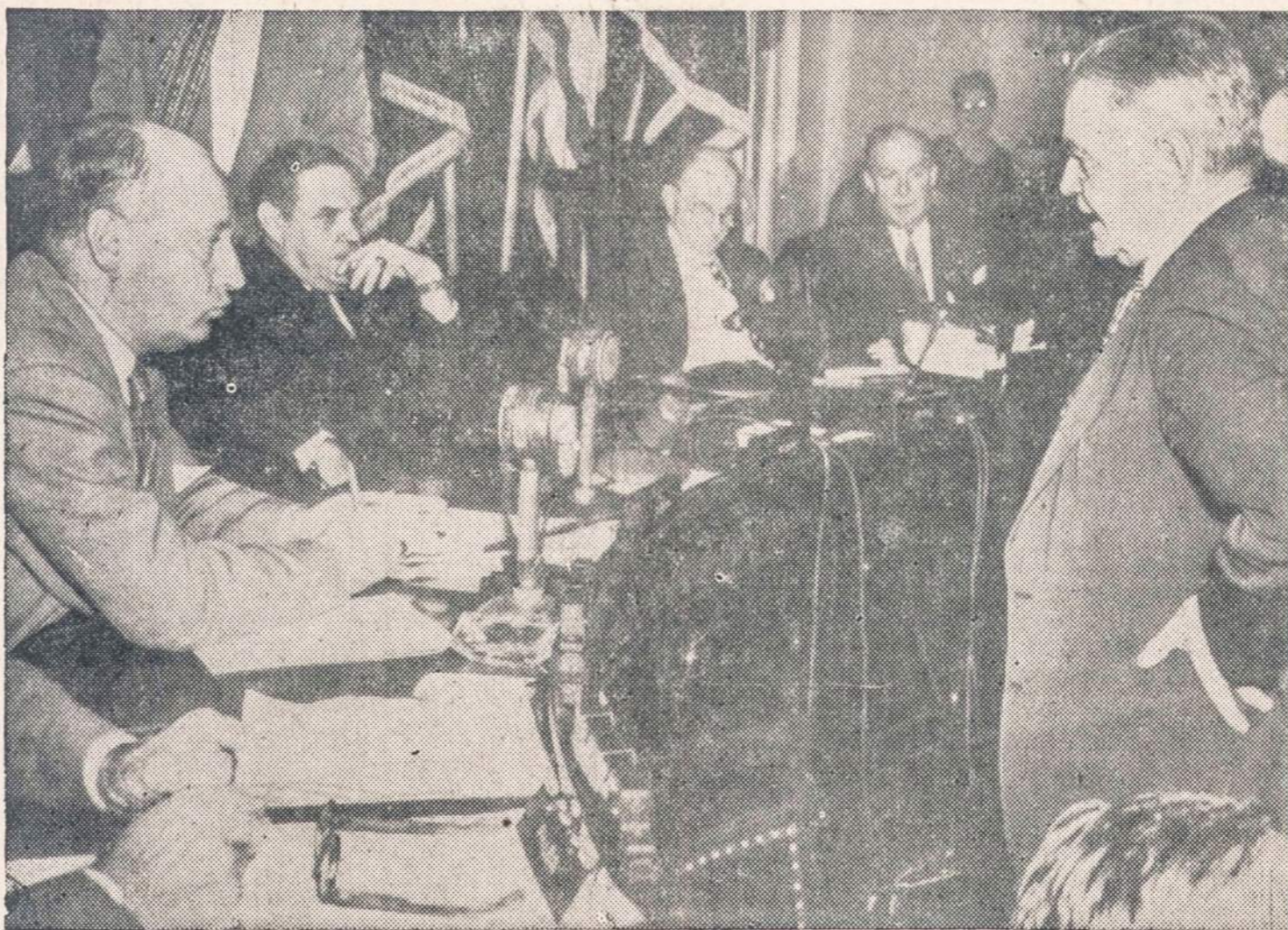
Adm. William Halsey liudija atstovų rūmų karo komitetui. Jis aštriai kritikavo strateginę aviaciją. Adm. Halsey pareiškė, kad B-36 lėktuvai galėtų sustabdyti tikrai priešų kulkas, bet ne priešą. Jam atrodo, kad šis lėktuvas netinka bombardavimams prieš užfrontę.