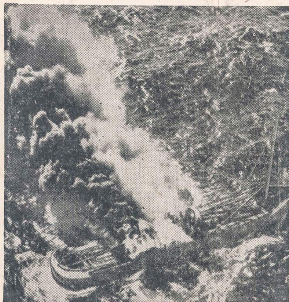
Seattle, Wash., pakraščiuose dega Panamos transporto laivas "Salina Cruz". Laivo įgula sukubo išlipti iš mažus laivelius ir išsigelbėti, o laivas, vežęs medžius, sudėgė ir nuskendo.