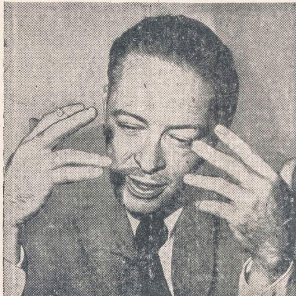
Kino filmų tekstų ruošėjas Dalton Trumbo pasodintas Venice, Cal., kalėjimam. Jis gerokai išsigerė ir labai neatsargiai važiavo automobiliu. Kada policininkai jį sulaukė, pradėjo koliotis. Savo laiku Trumbo buvo pakviestas liudyti kongreso komitete. Komiteto nariai norėjo sužinoti, ar jis priklausė prie komunistų partijos, bet Trumbo atsisakė pasakyti. Už atsisakymą liudyti Trumbo jau nuteistas.