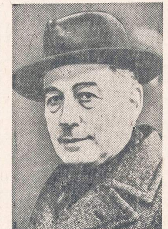
Prancūzijos prezidentas Auriol prašė buvusį finansų ministrį Rene Mayer sudaryti naują valdžią.

—Irano valdžia paskelbė karą stovį Persijos įlankos srityje. Gyventojai protestavo prieš rinkimus, užmušė tris rinkimų komisijos narius, neteislingai skaičiusius balsus. —Rumunijos valdžia pripažino rusų sudarytą Rytų Vokietijos valdžią.