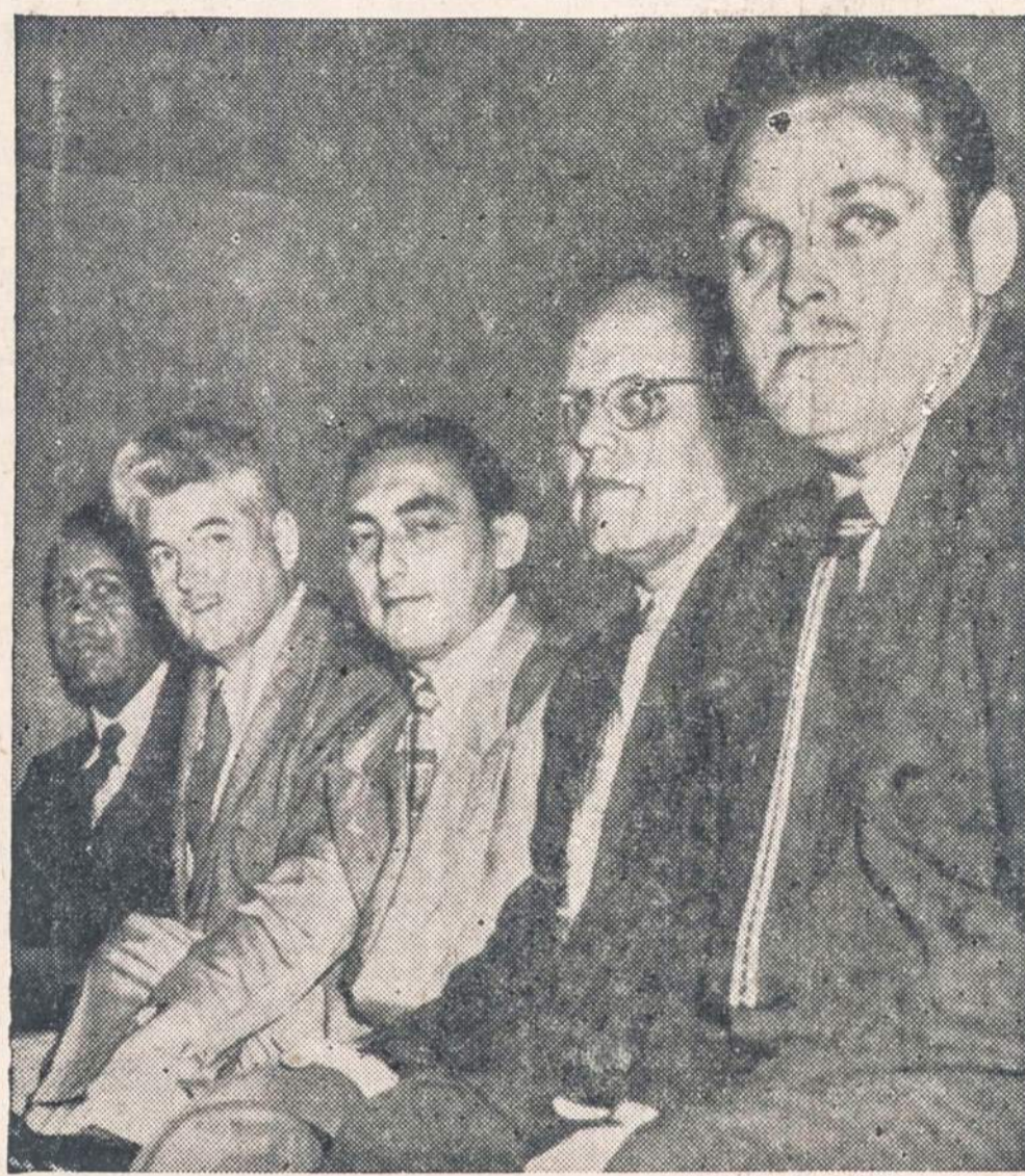
Teisėjas Harold Medina nuteisė 11 Amerikos komunistų partijos centro komiteto narių. Jie turės praleisti po penkeris metus kalėjime ir sumokėti po 10,000 dolerių baudą. Paveiksle matome kelis nuteistuosius, vežamus į New Yorko kalėjimą.