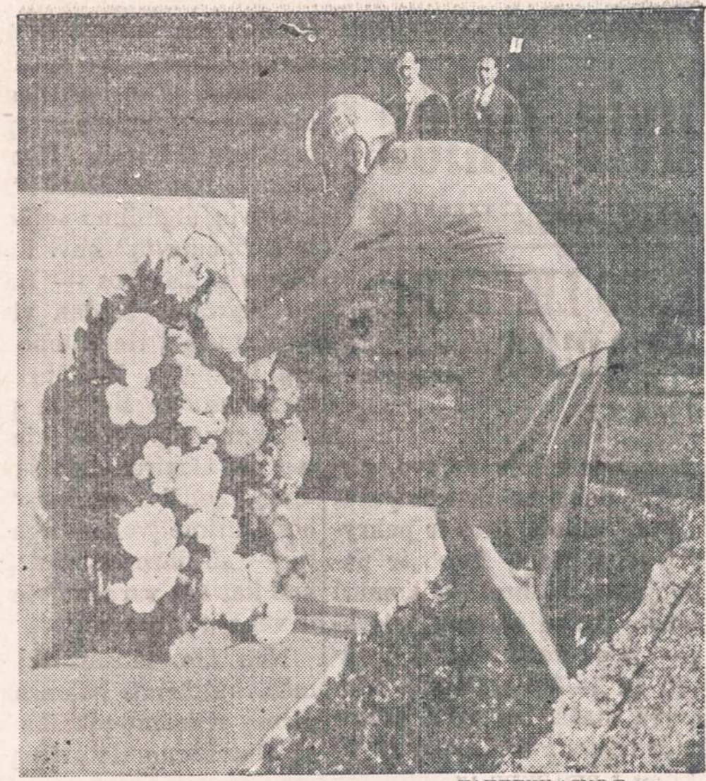
Indijos premjeras Nehru pagerbė Franklin D. Roosevelta, Hyde Parke padėjo vainiką ant buvusio prezidento kapo.

Nežinia, ar politikieriai prikiša savo nagus prie to biznio (kaltinant, reikėtų paduoti faktus), bet yra žinoma, kad Chicago susisiekimo priemonės buvo subankrotavusios per 30 ar 40 metų, kada jas valdė privačios kompanijos. "Resyveriai" ir advokatai naudojosi,