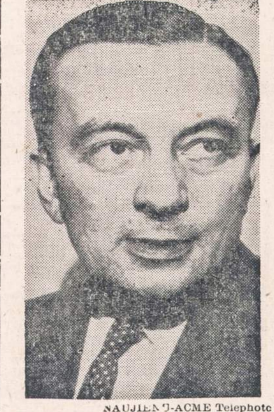
NAUJENŲ AGENTŲ TELEFONAI Francūzijos prezidentas Vincent Auriedl ppareižo Georges Bidault sudaryti naują kabinetą. Bidault keliose koalicinėse valdžiose čjo užsienio ministerio pareigas. Jis yra įtakingas katalikų veikėjas.

International Rescue nad Relief Committee 103 Park Avenue, New York 17, N. Y. GENTLEMEN: I gladly contribute $..... to the International Rescue and Relief Committee for its special Lithuanian resettlement fund. Name ..... Street ..... City ..... Zone ..... State ..... (Čekyje arba Money Orderyje rašykite International Rescue and Relief Committee, Inc.)